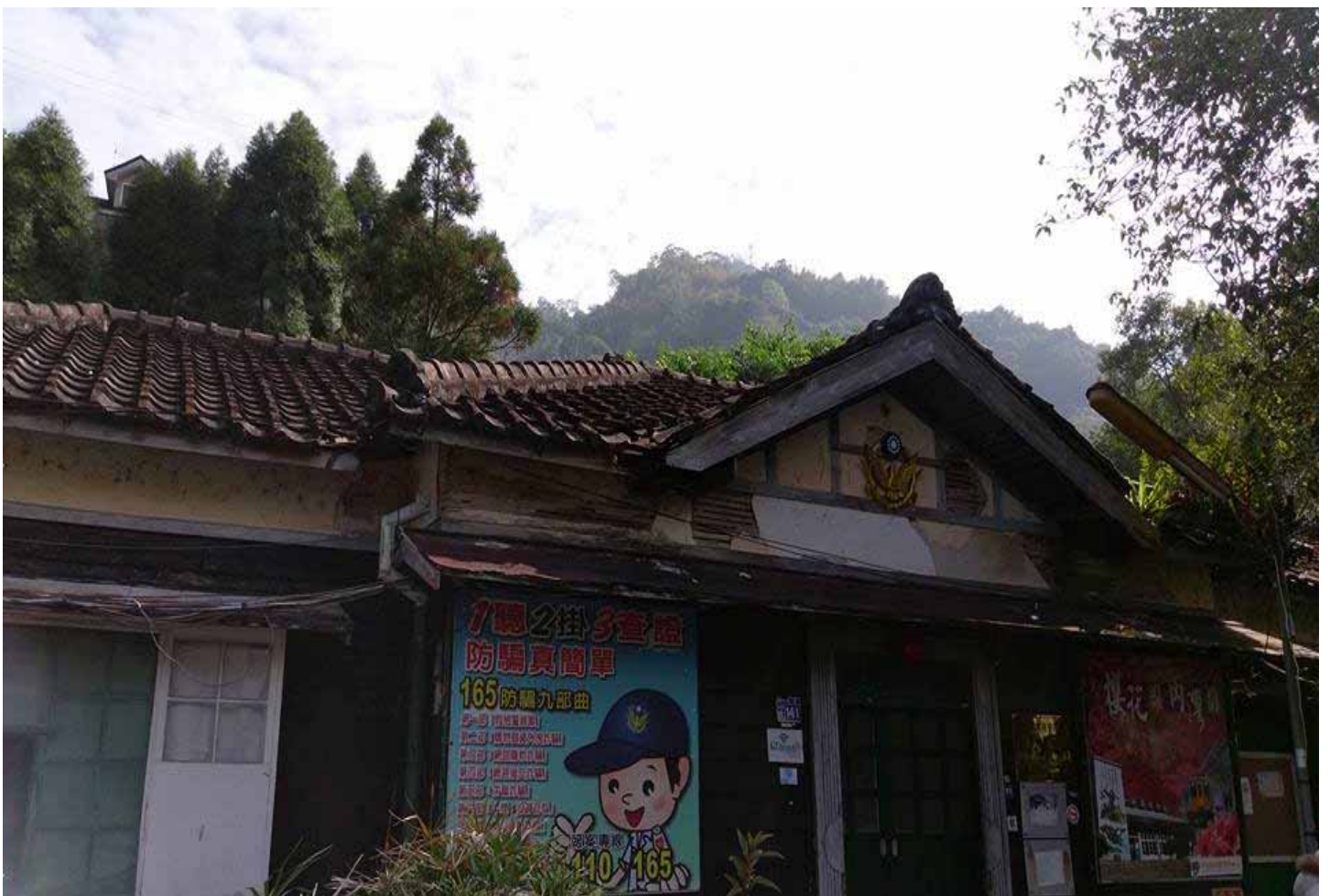
三級古蹟、仍在使用的內灣派出所，保留著日治時期原有的樣貌