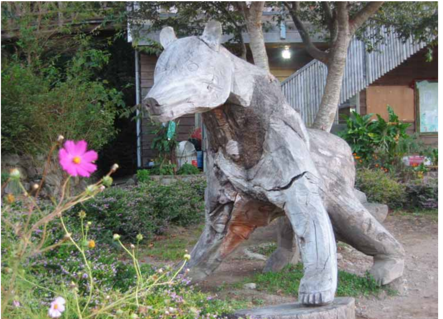
部落裡處處可見泰雅族人的雕刻作品