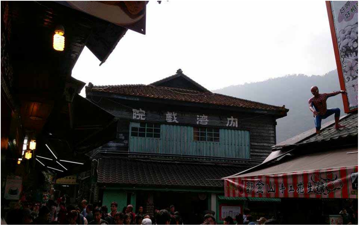
內灣戲院是民國 39 年，林場老闆用上好建材，為提供工人娛樂場所而蓋