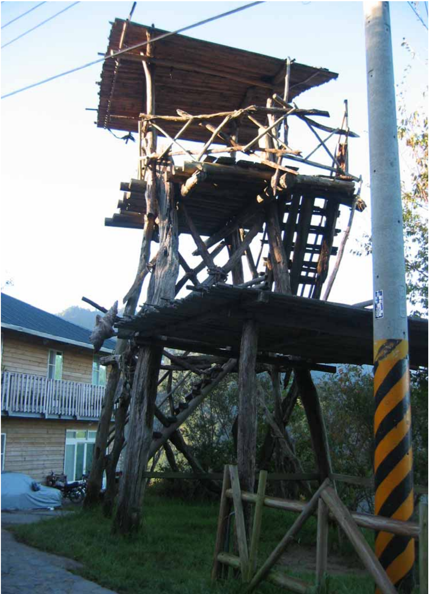
瞭望台，可隨時監看覬覦獵場的敵族