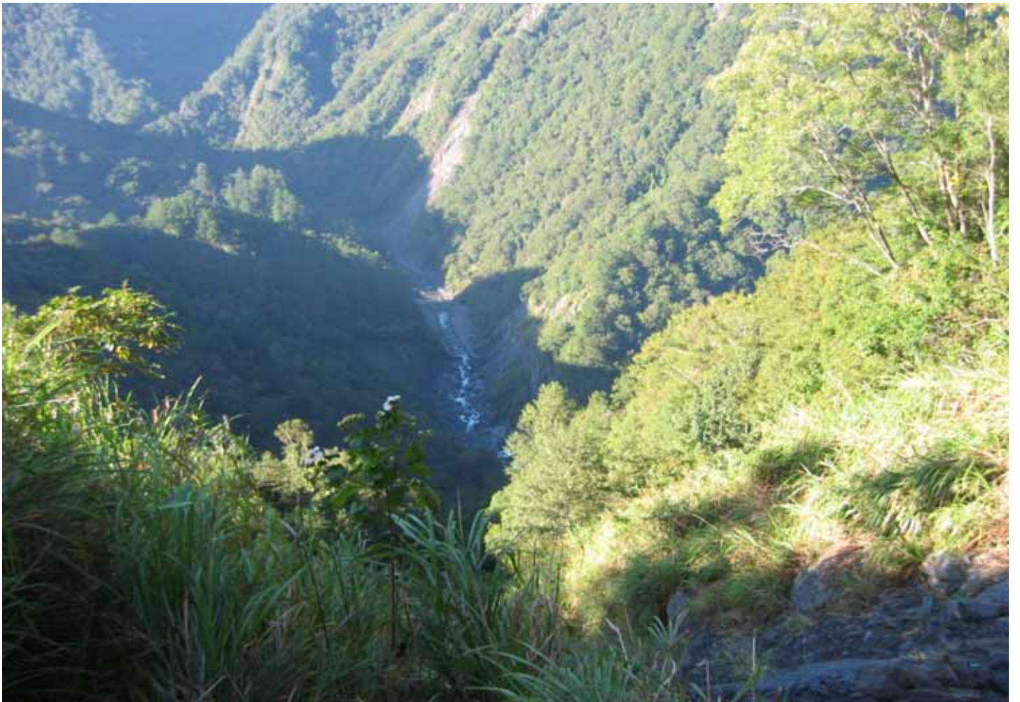
站在斷崖上，可俯看山谷下的塔克金溪