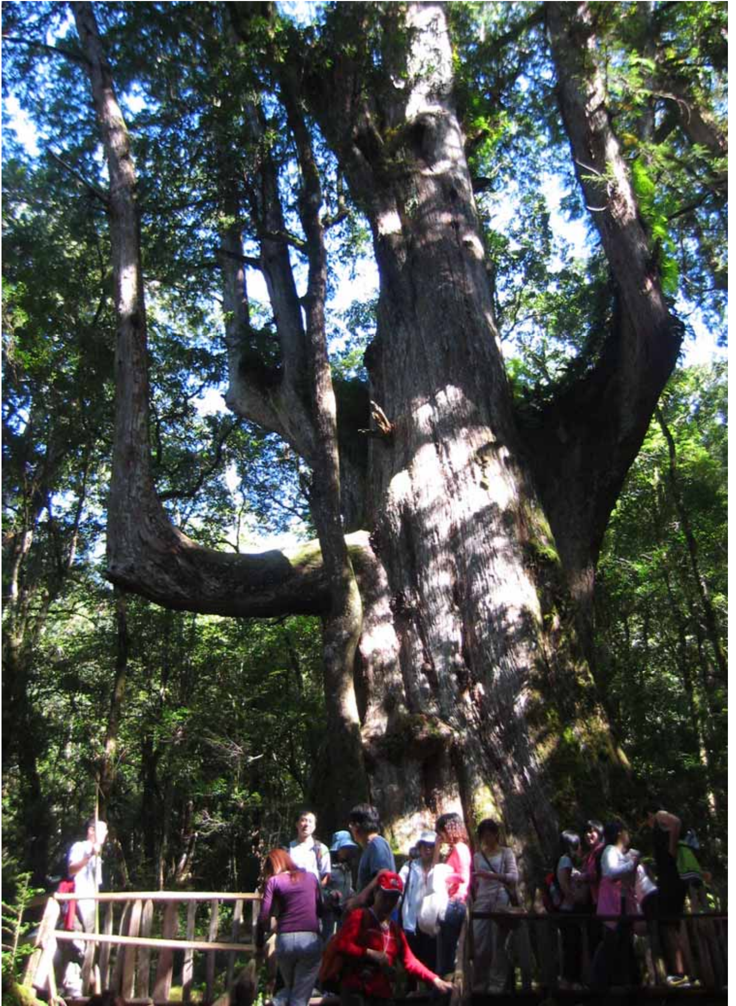
神木群之一”山大王”：大老爺神木，已 2500 歲，高舉雙臂歡迎遊客