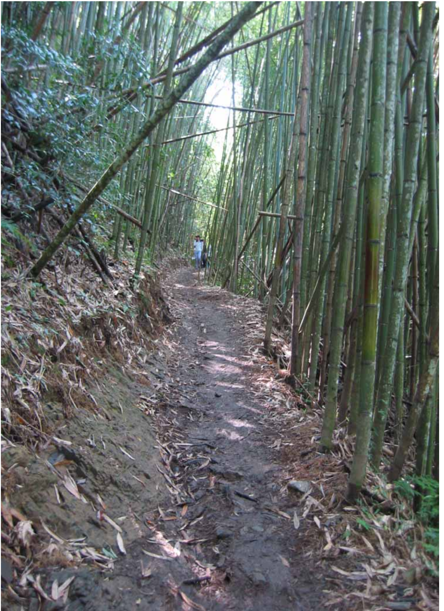
沿途茂盛的桂竹林，宛如置身在電影臥虎藏龍的拍片場