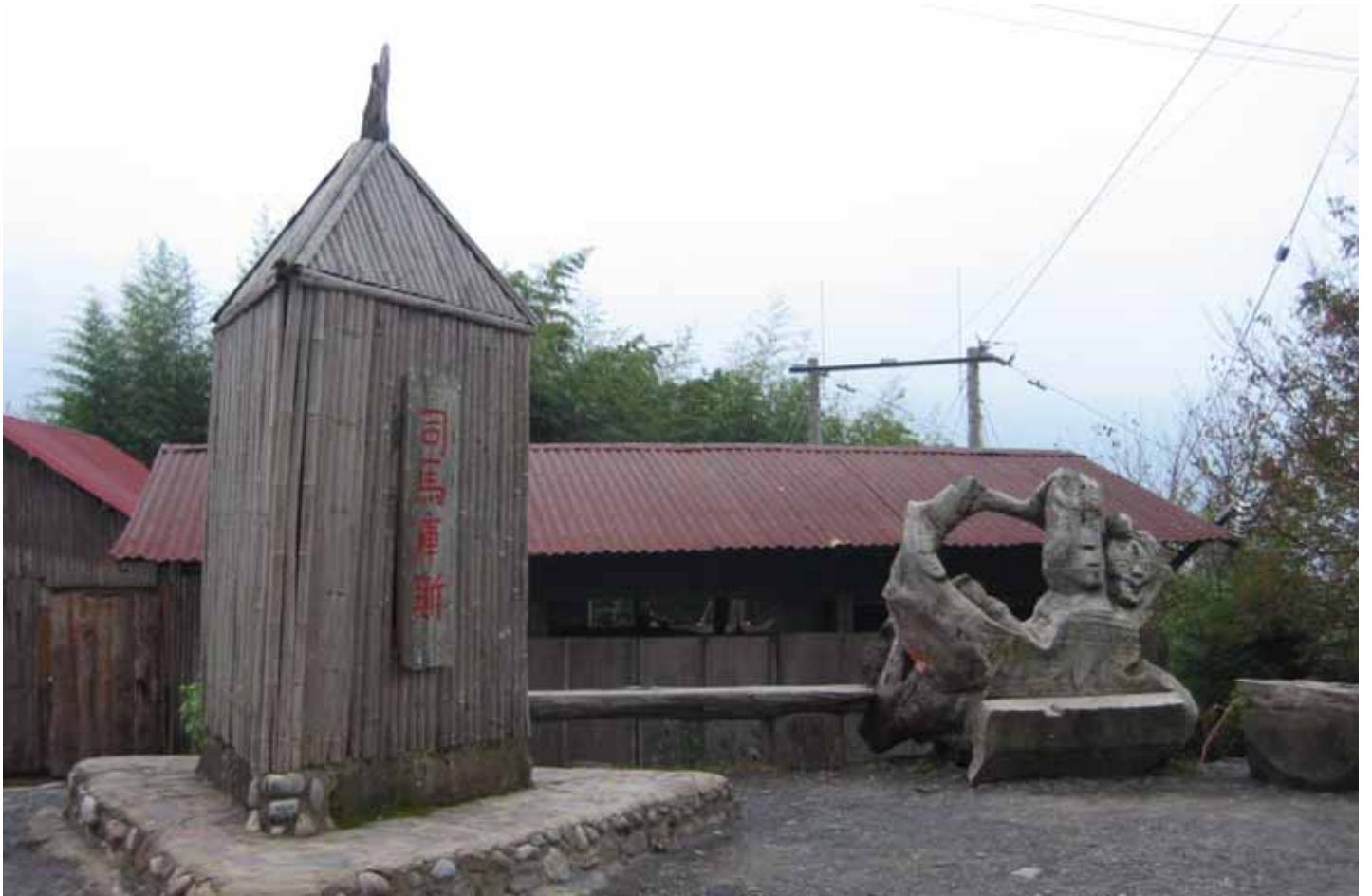
黑色部落司馬庫斯：在海拔 1600 公尺的雪白山，族人過著共享的生活