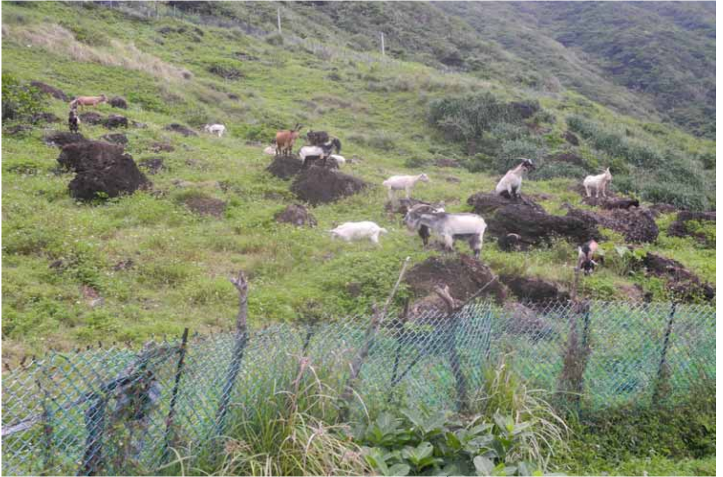
山坡上隨處可見的羊群