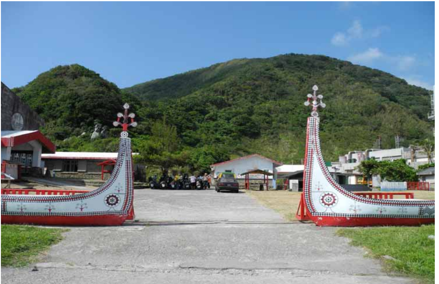
以紅、黑、白為主，線條優美的拼板舟，充份表現達悟族人的藝術天份