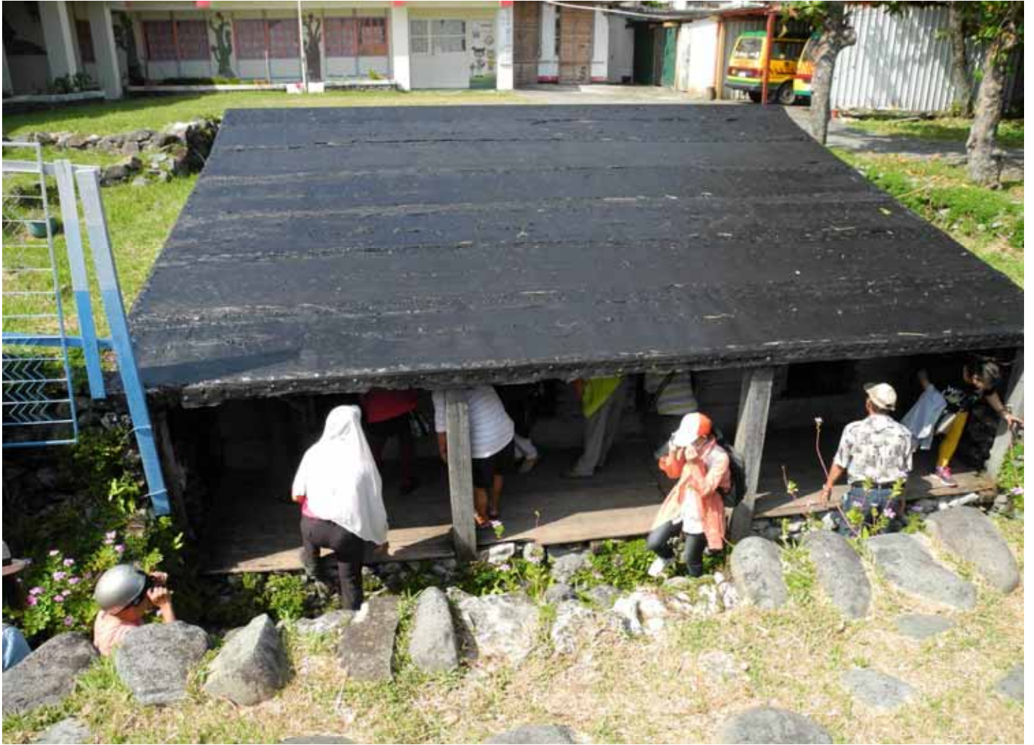
為適應島上特殊氣候(高溫、多雨、多颱風)而發展出獨特半穴型的地下屋