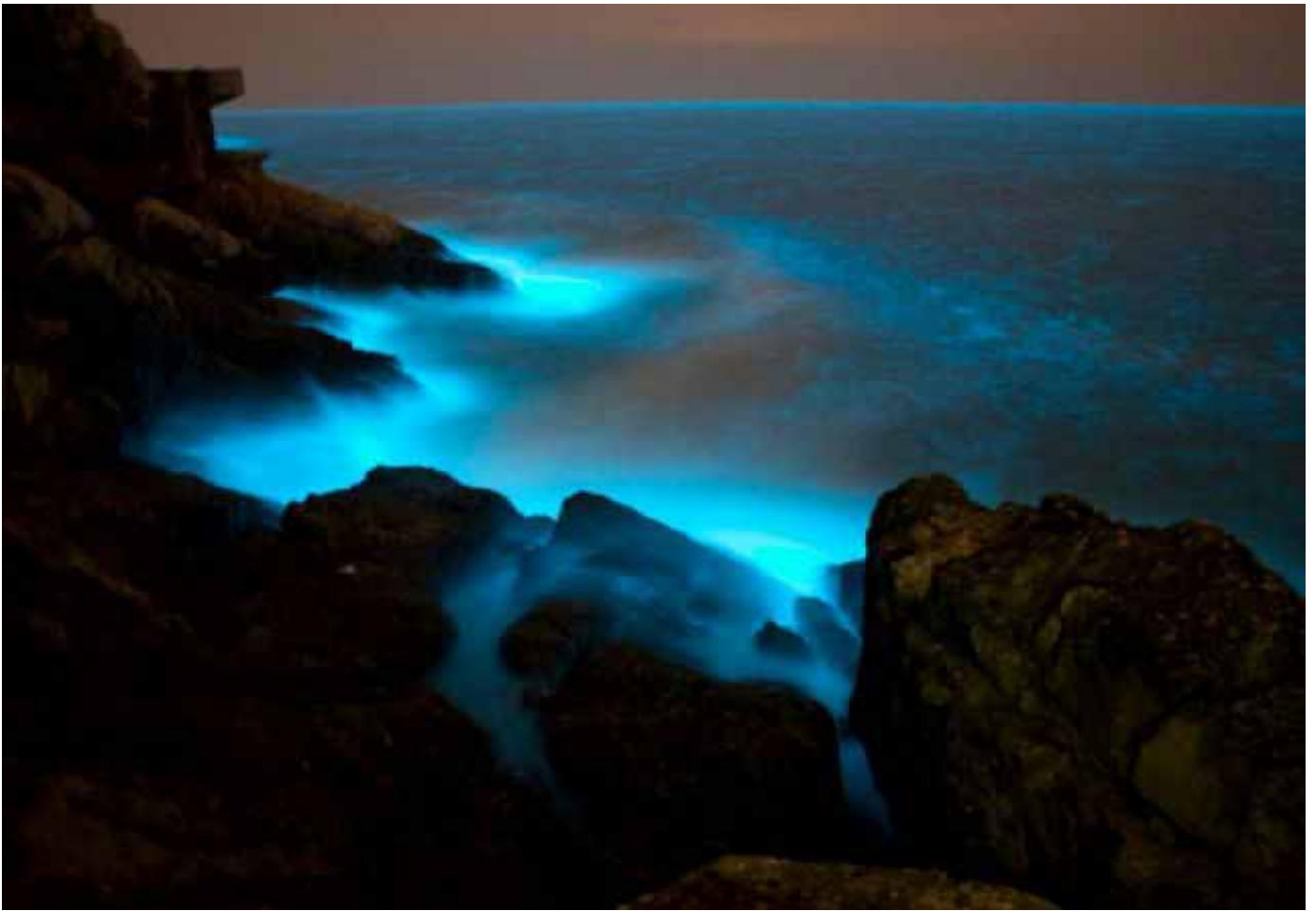
藍眼淚為自然現象，每年 4~8 月是好發大量期