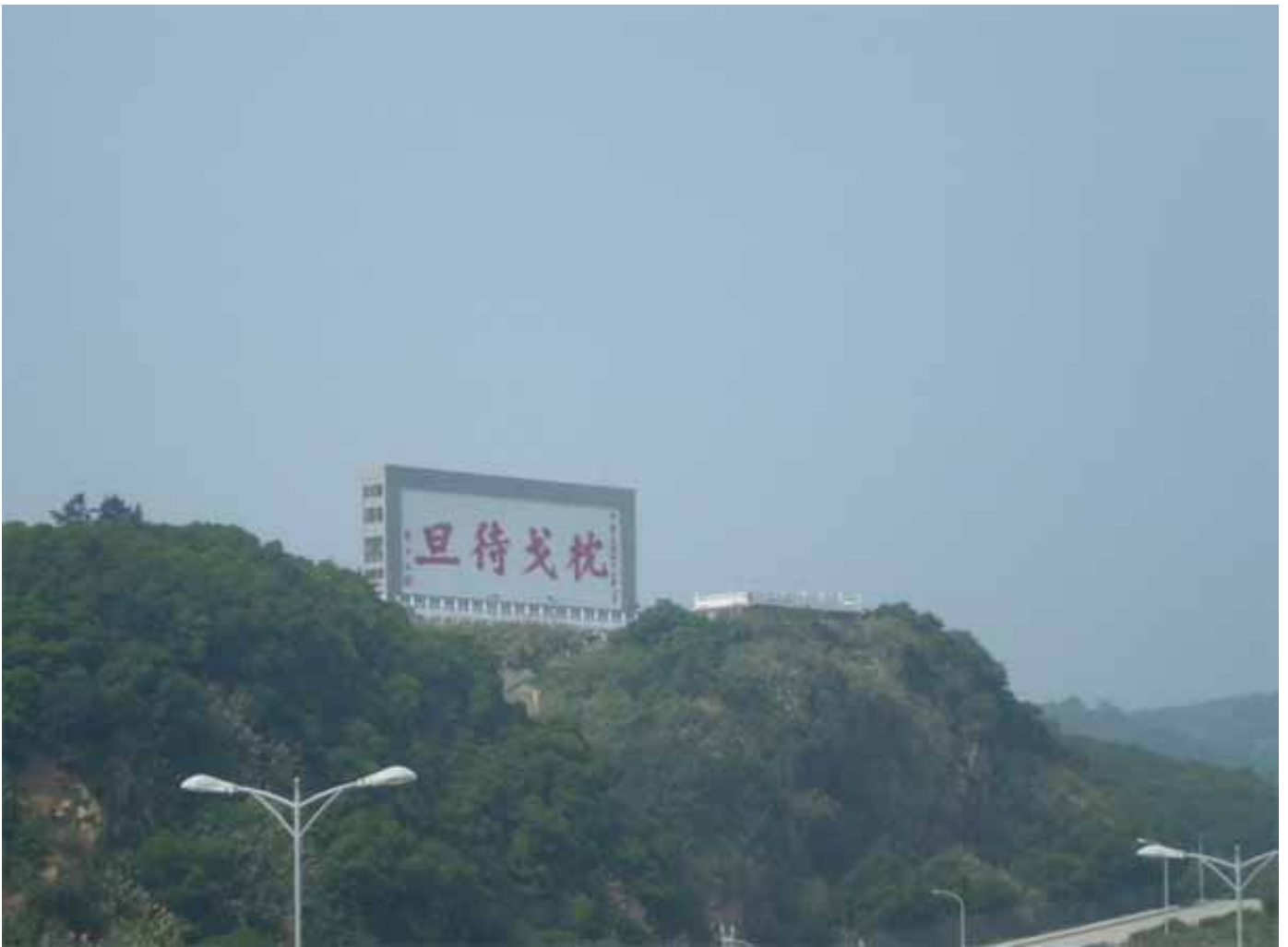
曾為戰地前線的馬祖，至今仍留有許多的精神標語