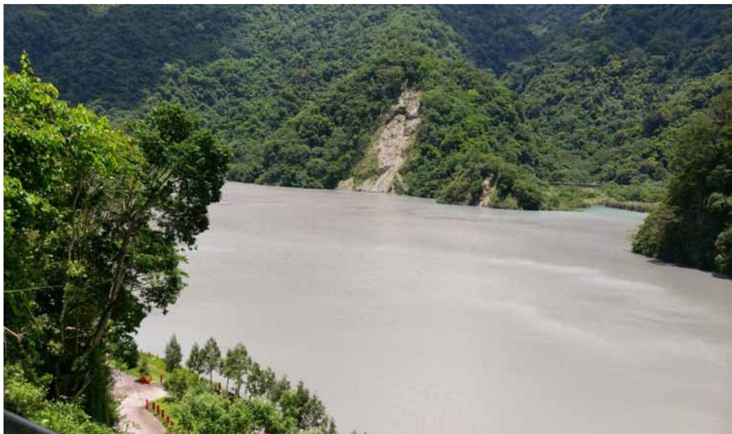
武界壩的功用，在攔截濁水溪上游的沙石，再排放到日月潭