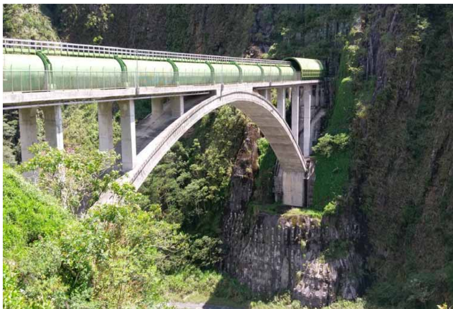
綠色水管乃是引栗栖溪，並與武界水壩的引水道共同導入日月潭