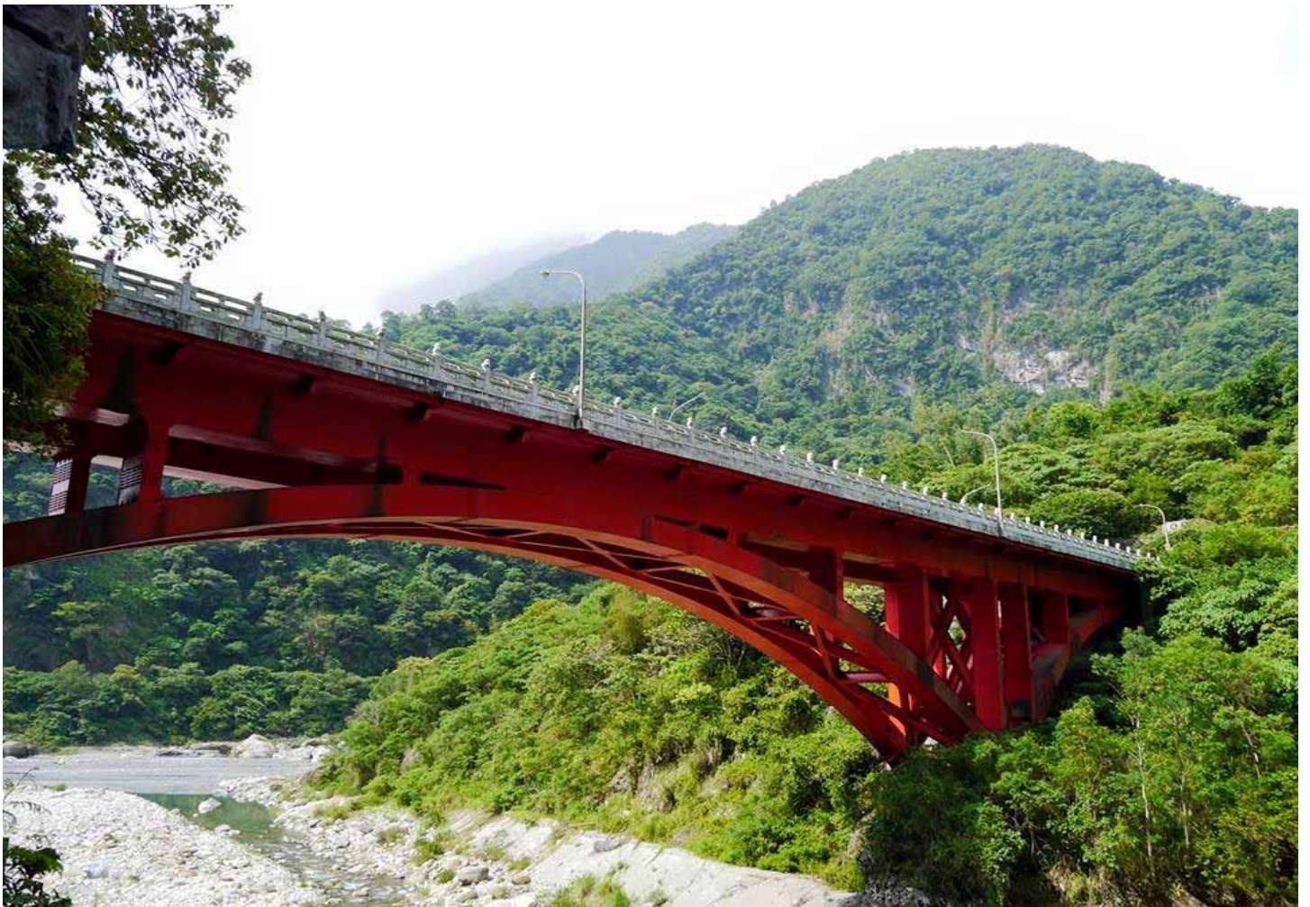
百獅橋下是立霧溪支流-砂卡礑溪