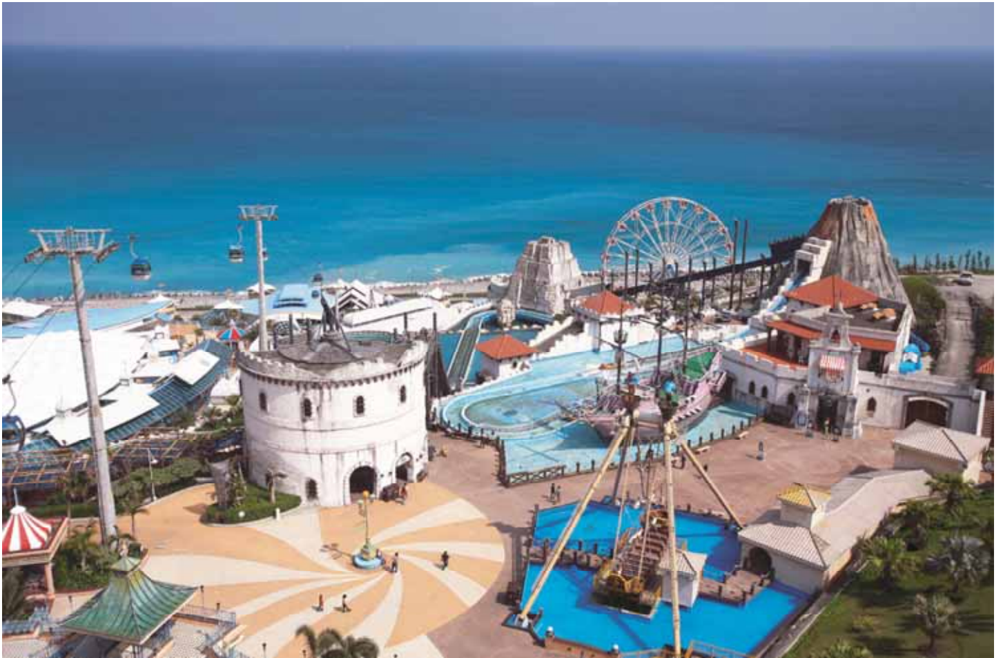
海洋公園依山而建，面對湛藍太平洋，令人感到神清氣爽