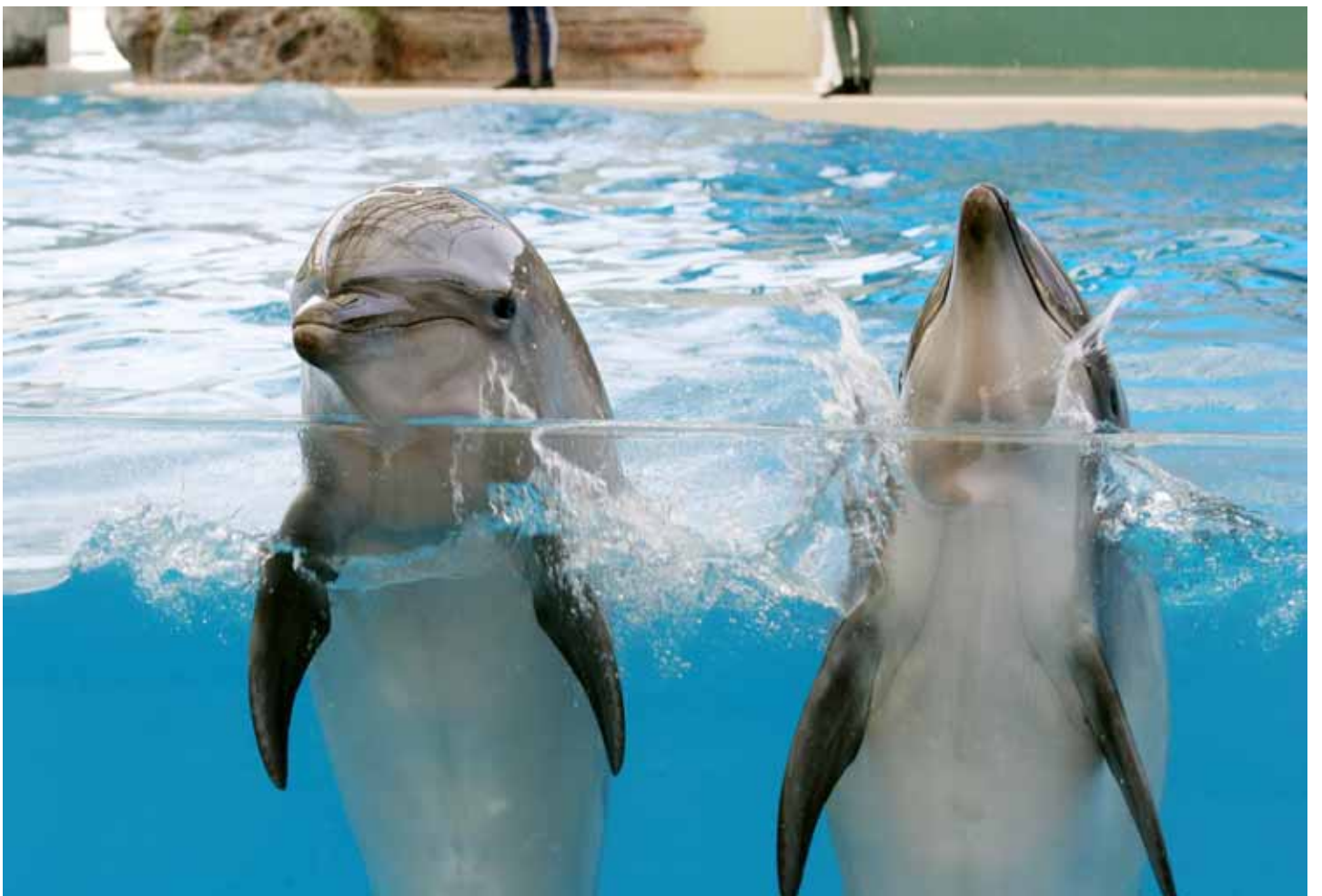
海豚、海獅、美人魚，以及精彩絕倫的外國團隊表演，是老少皆宜的樂園