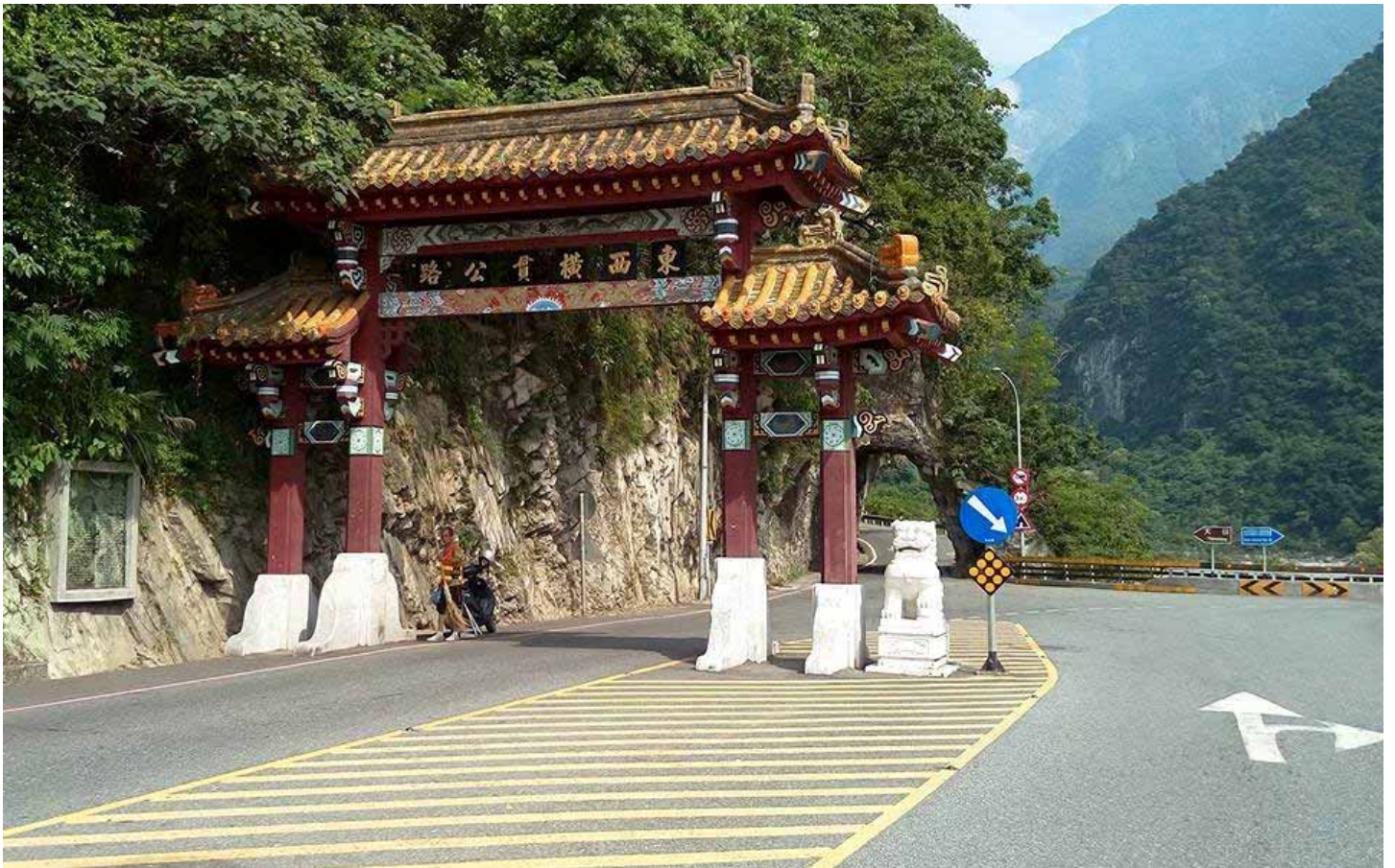
東西橫貫公路(中橫)，是榮民耗費三年九個月血汗開闢出來的公路