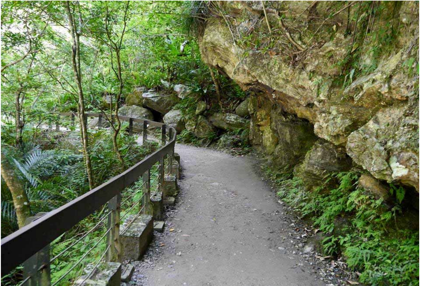
砂卡礑步道，是太魯閣族祖先所走古道，曾在遺址發現臼齒而得名