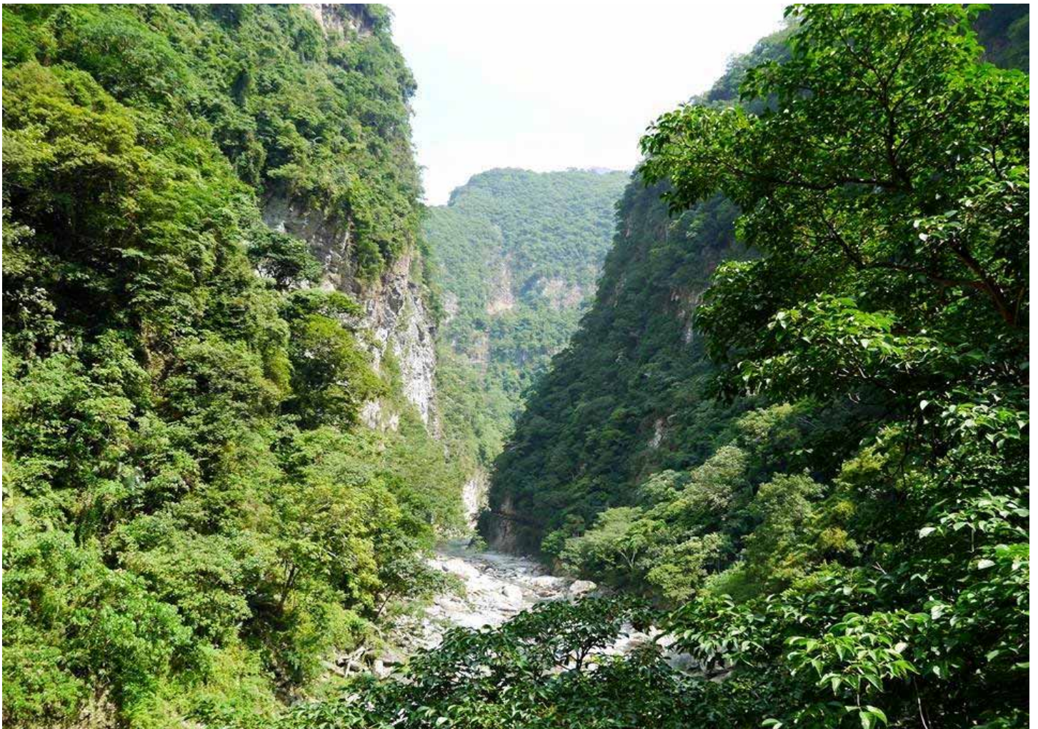
太魯閣國際級的峽谷地形，是由立霧溪千百萬年切穿而成的