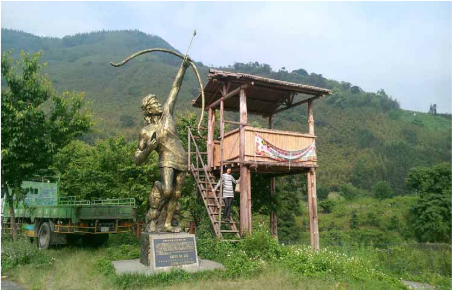
位於雪霸國家公園裡的雪見森林，在深山中保留純樸的泰雅文化