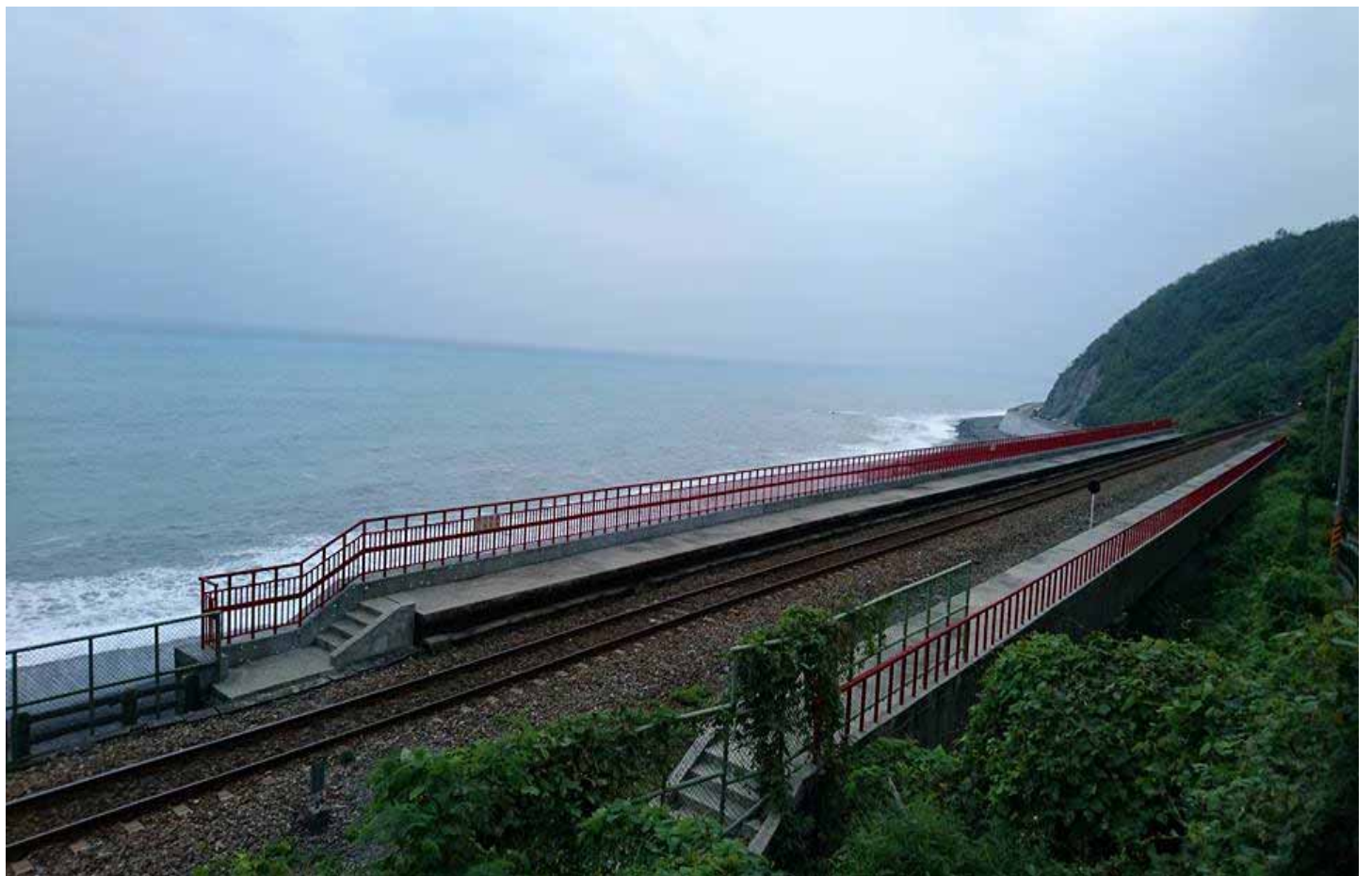
多良車站是公認台灣最美的車站，有迷人的美麗海景可欣賞