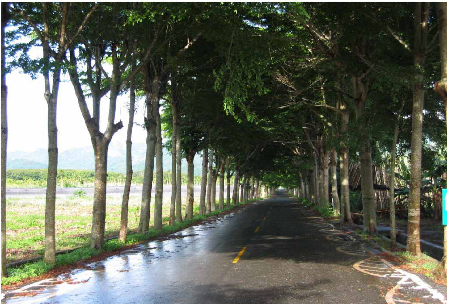
騎在小葉欖仁織成的龍田綠色隧道，自在享受悠閒、遠山環繞的田野風光