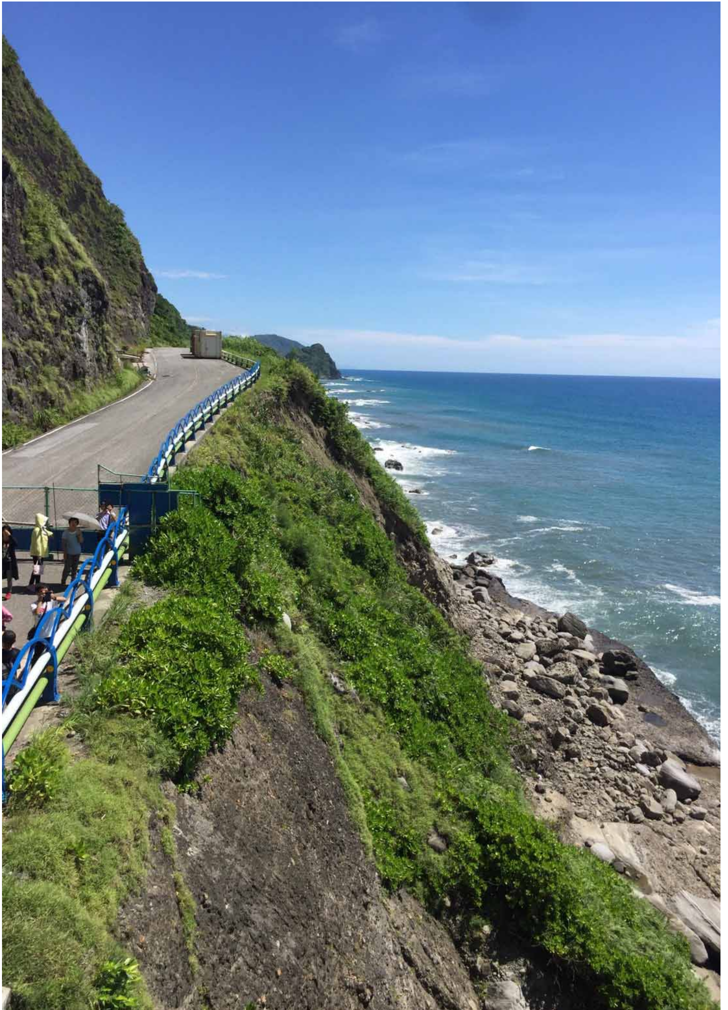
親不知子天空步道，腳下是平均 4000 公尺深的浩瀚太平洋