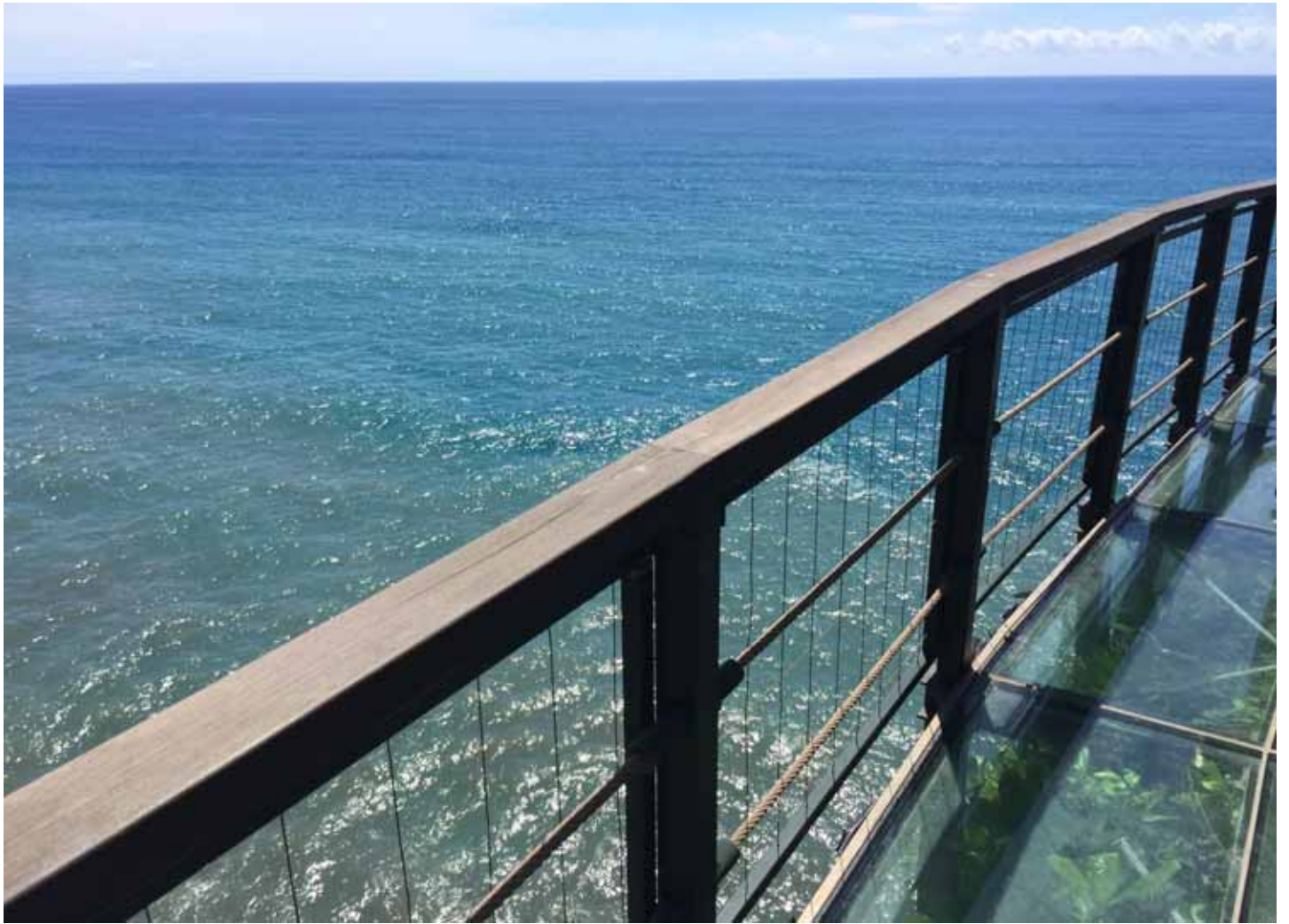
親不知子天空步道，是早期阿美族人出入的唯一步道，懸崖峭壁驚險萬分