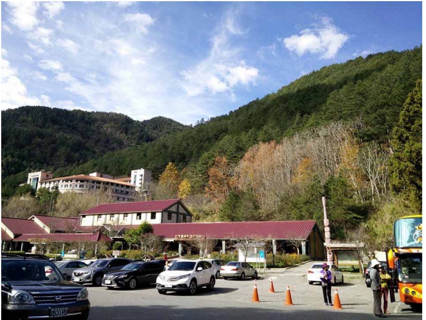
雪山山脈圍繞著的武陵農場，四季有不同的美感，是避暑首選之地