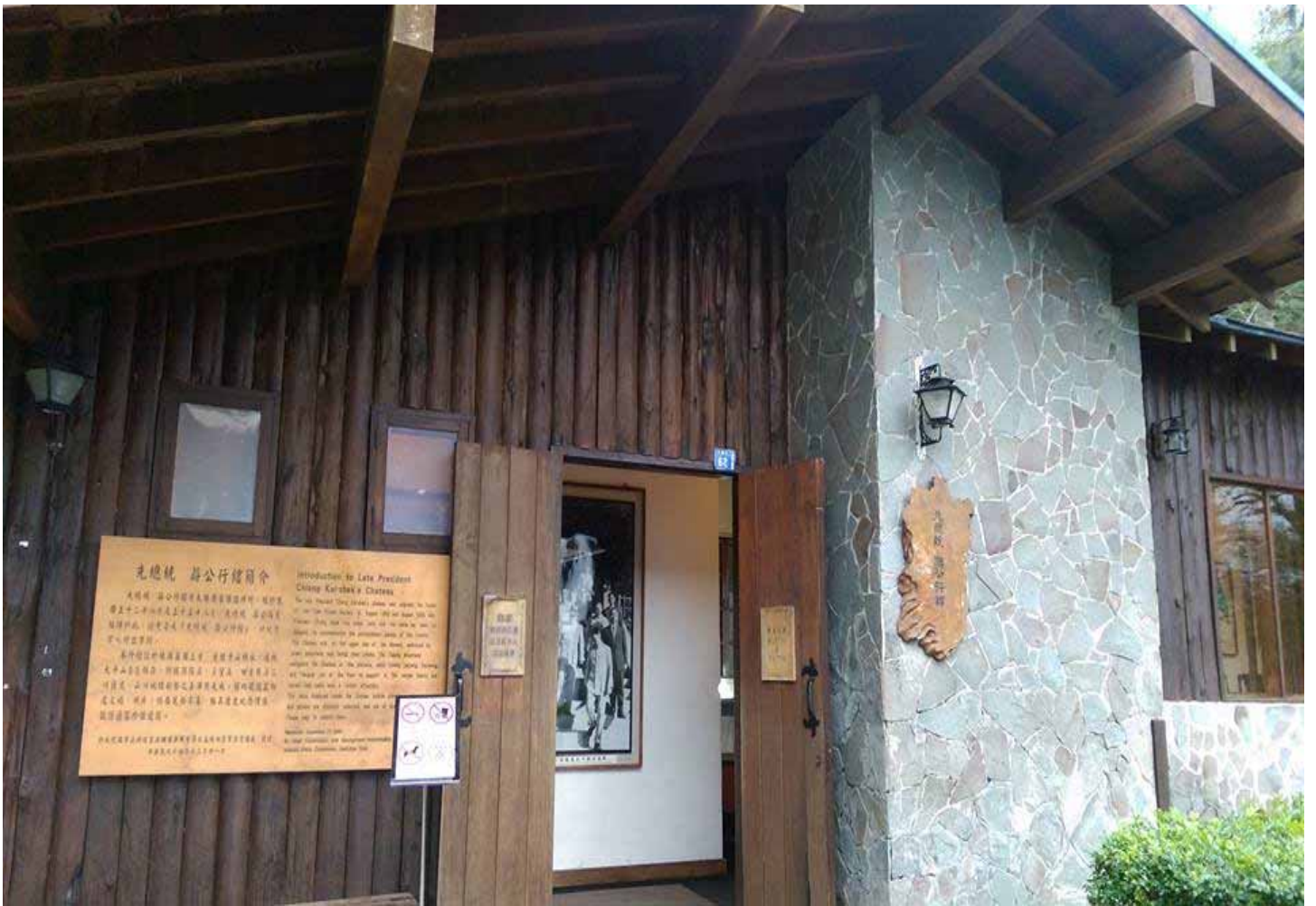
棲蘭森林遊樂區，是蔣總統理想的風水寶地-三龜拱壽，因此設有行館