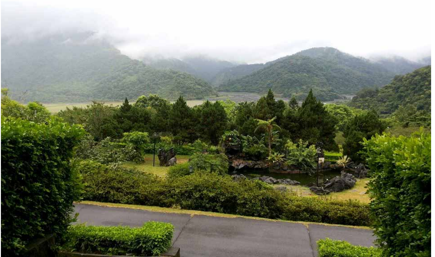
棲蘭原是行政院退輔會森林保育處的苗圃，滿園蒼翠、風光怡人