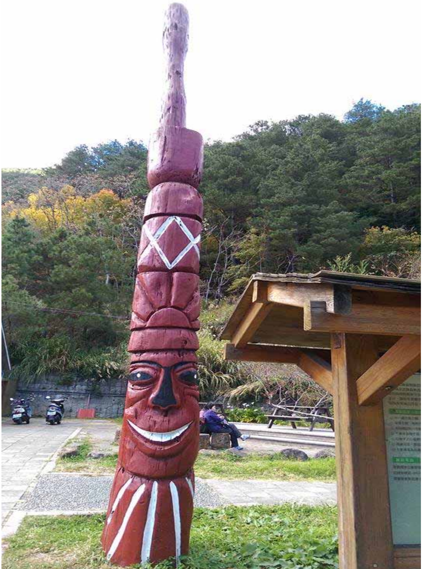
早在數千年前，泰雅族人在此落地生根