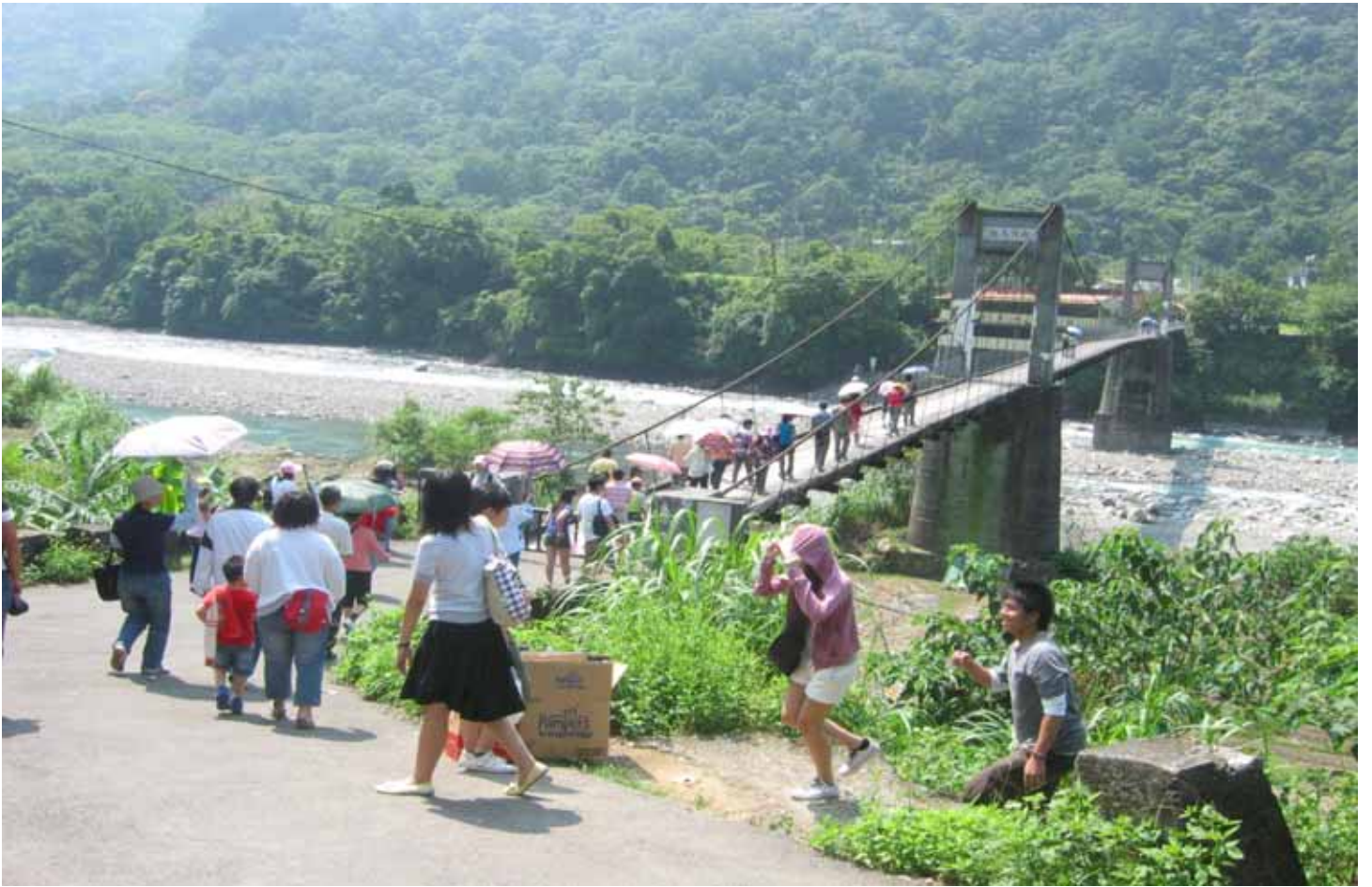
位於油羅溪上方的內灣吊橋