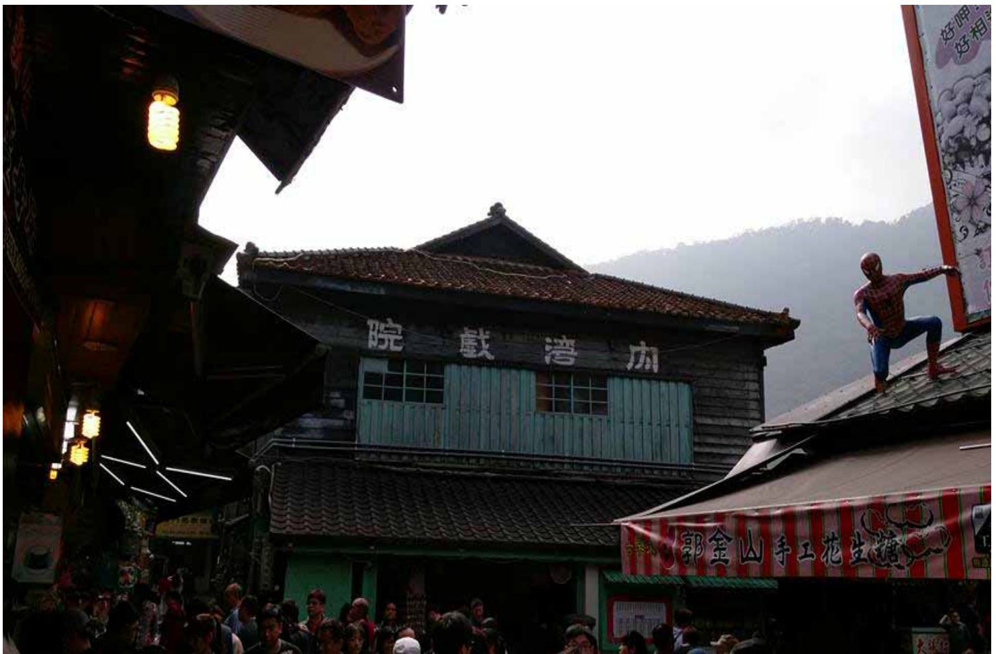
內灣戲院是民國 39 年，林場老闆用上好建材，為提供工人娛樂場所而蓋