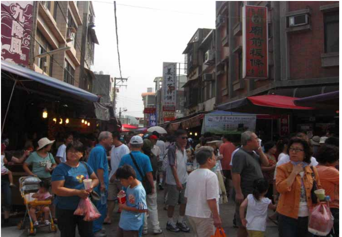
販賣古早味、北埔及客家特色小吃，熱鬧滾滾的北埔老街