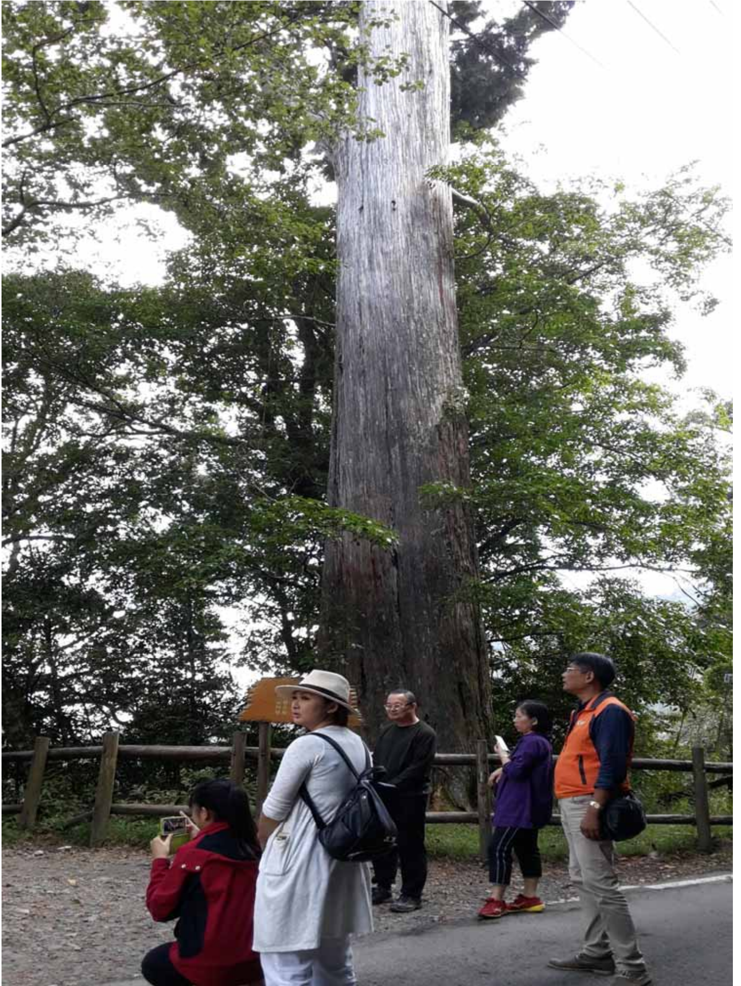
位於雪霸國家公園裡的觀霧，擁有千年紅檜、扁柏珍貴巨木