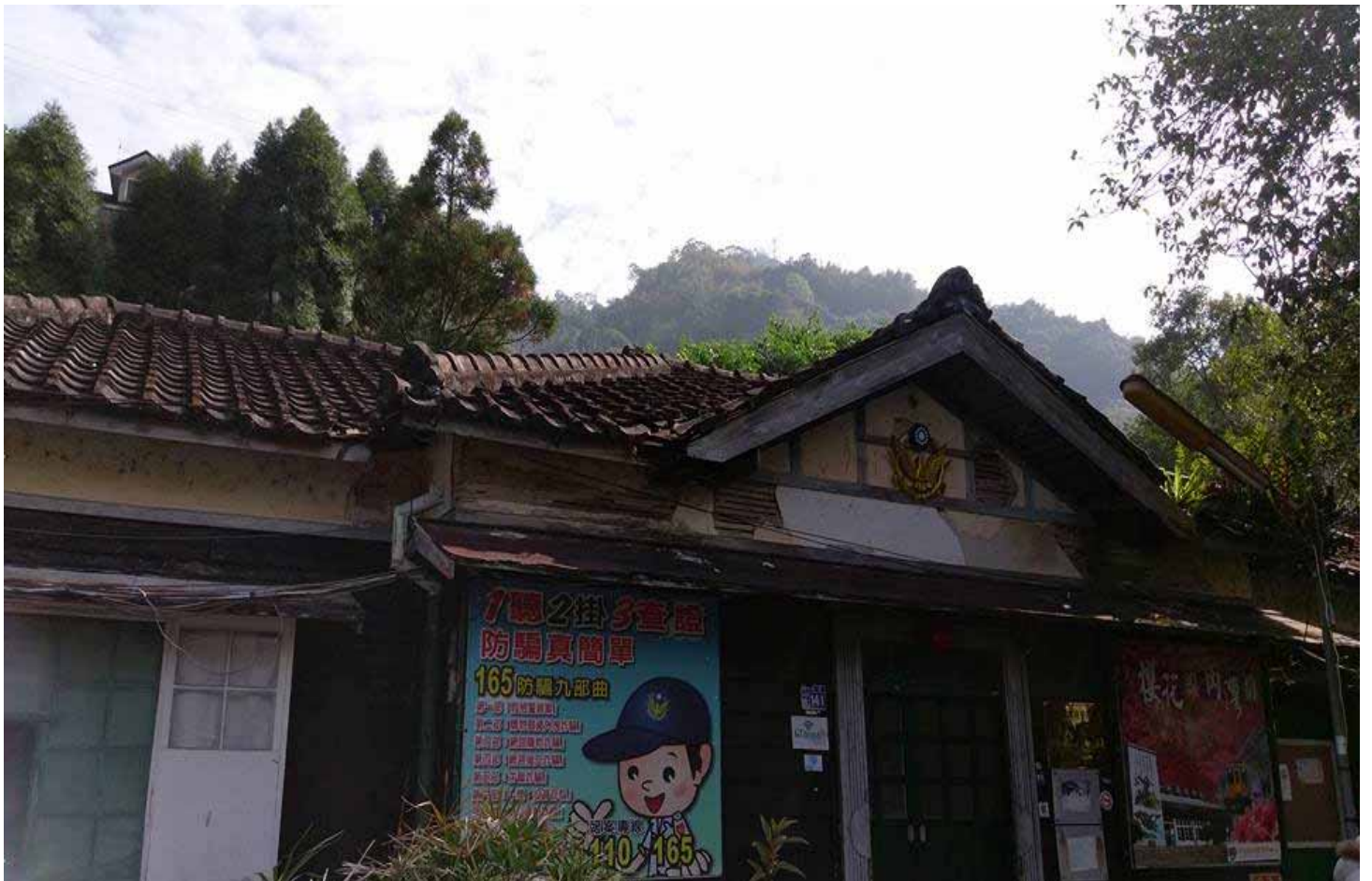
三級古蹟、仍在使用中的內灣派出所，保留著日治時期原有的樣貌