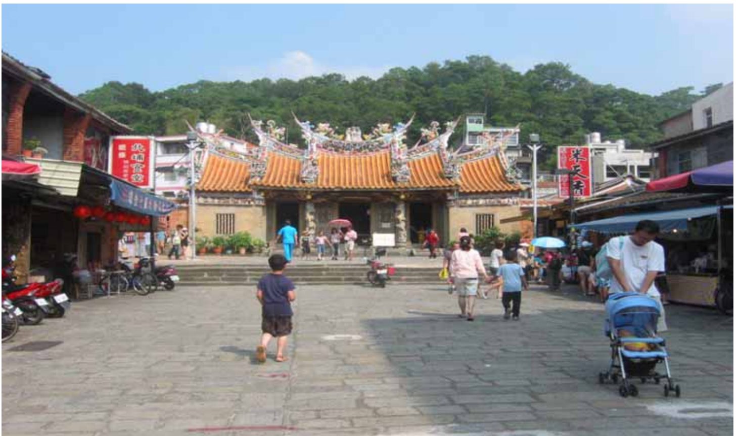
三級古蹟慈天宮因位於睡虎穴，地方上甚少舉行建醮