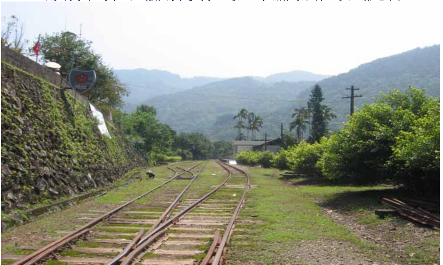
台灣三大支線火車之一的內灣線，來來往往承載許多人的回憶