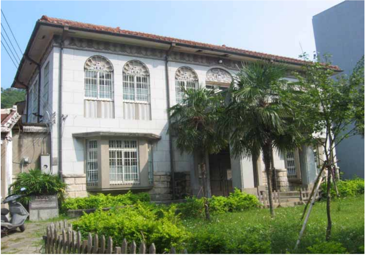
姜阿新宅結合西方、日式與中國的建築語彙，為建築史上重要作品