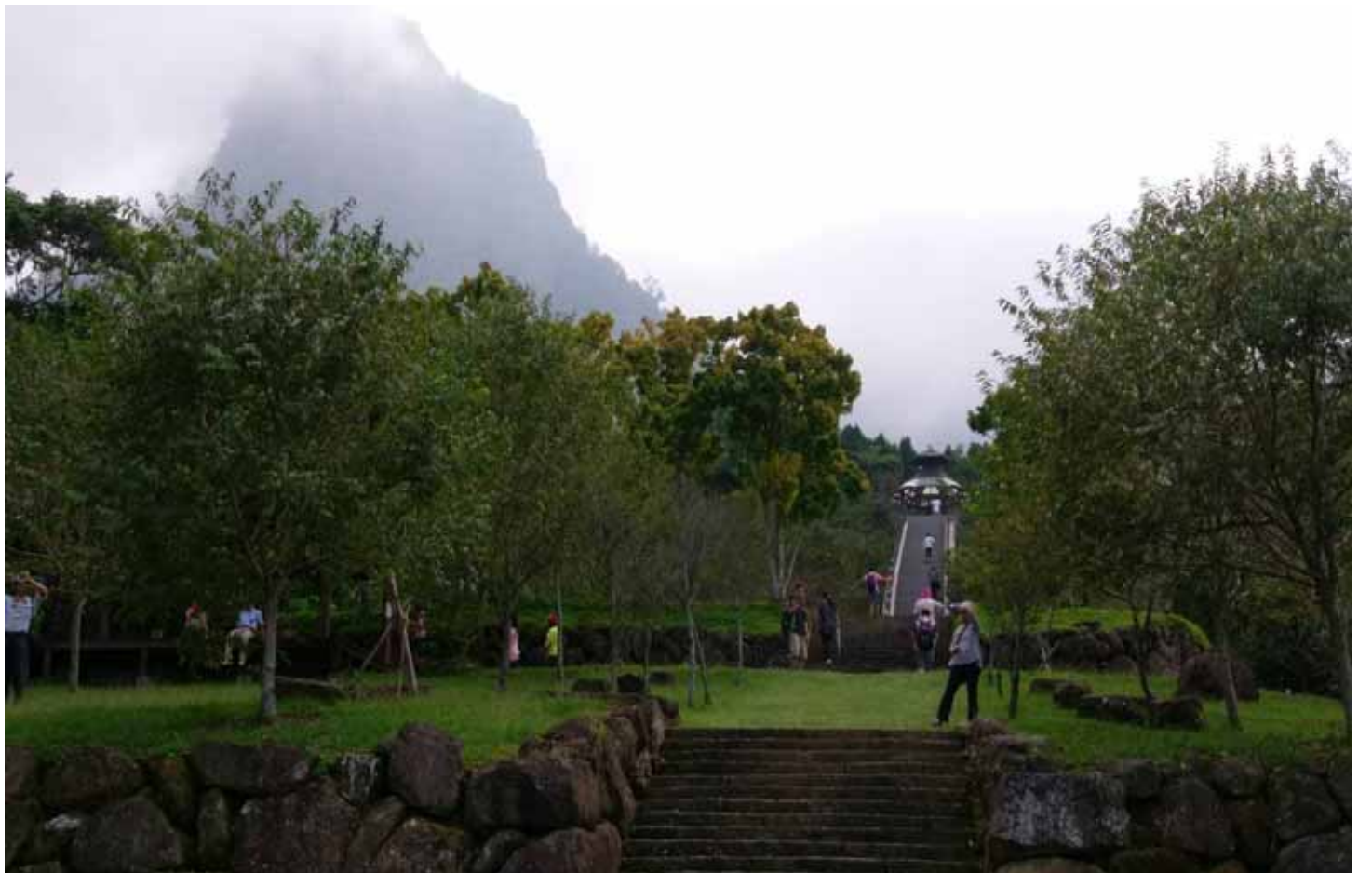
寒溪呢是充滿靈氣、擁有特殊建築的人文叢地，站在高點視野相當遼闊