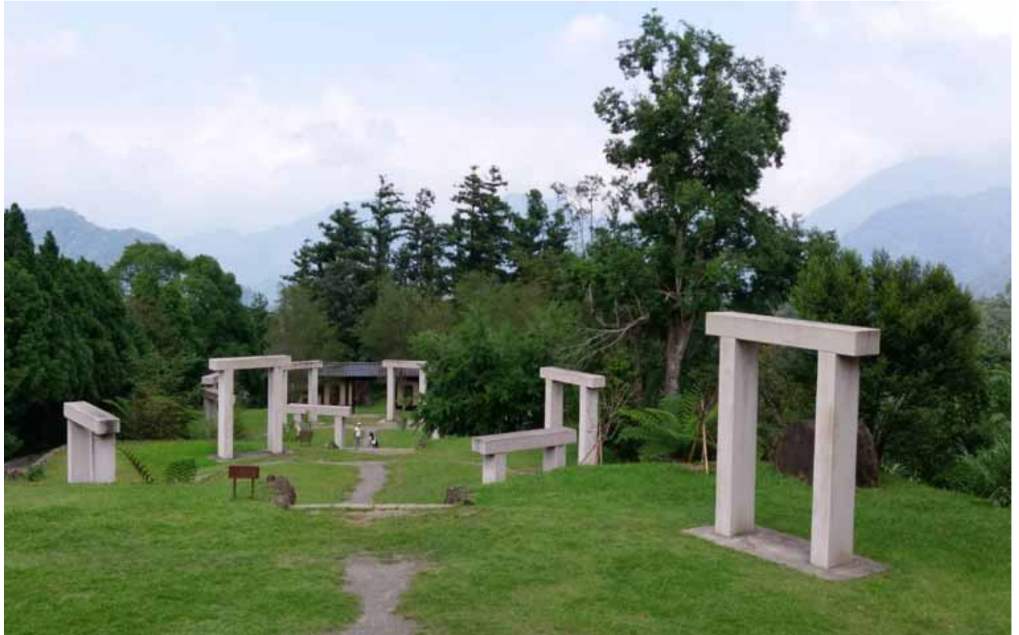
園區以易經理念，佈置八卦、四象、兩儀和太極亭，據說有無形能量