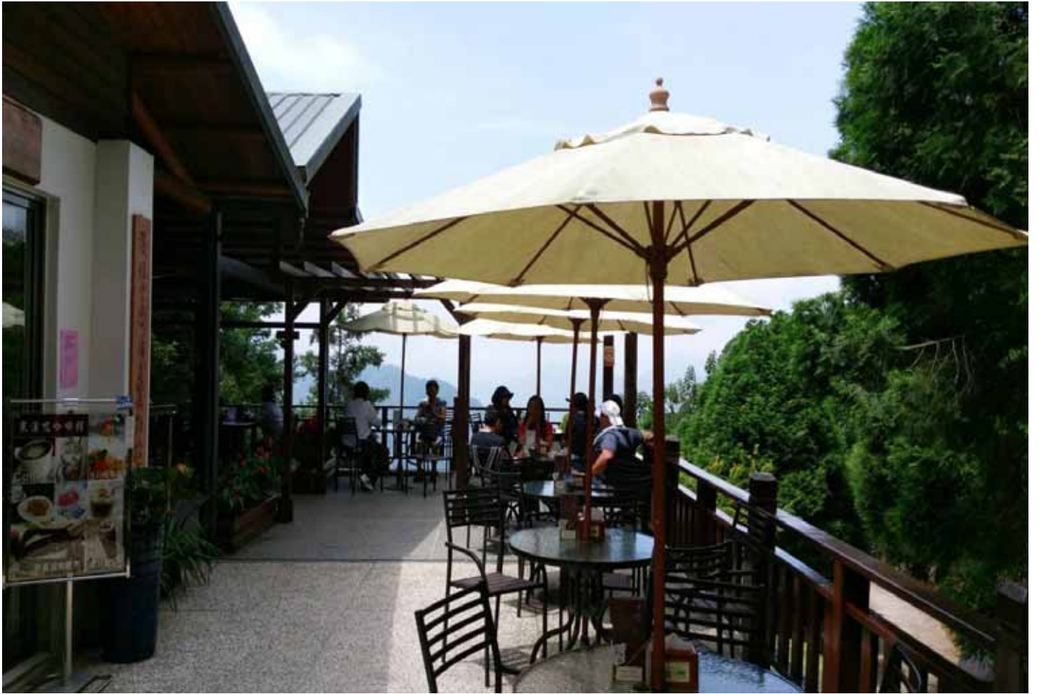
在清幽的環境裡，放鬆心情，享用園區裡經典套餐