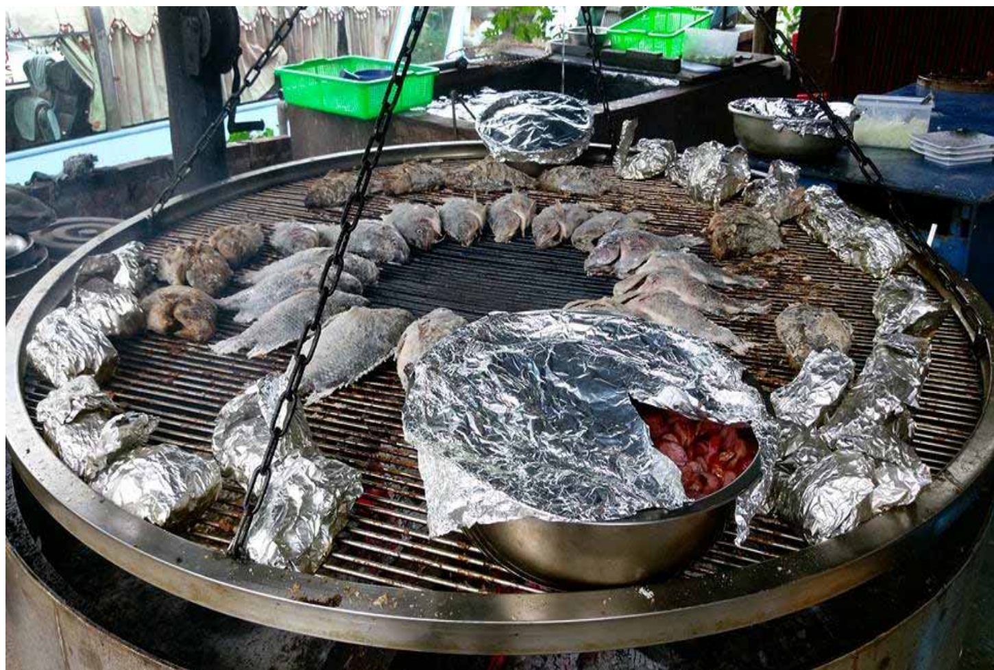
總令人垂涎三尺的原住民風味餐