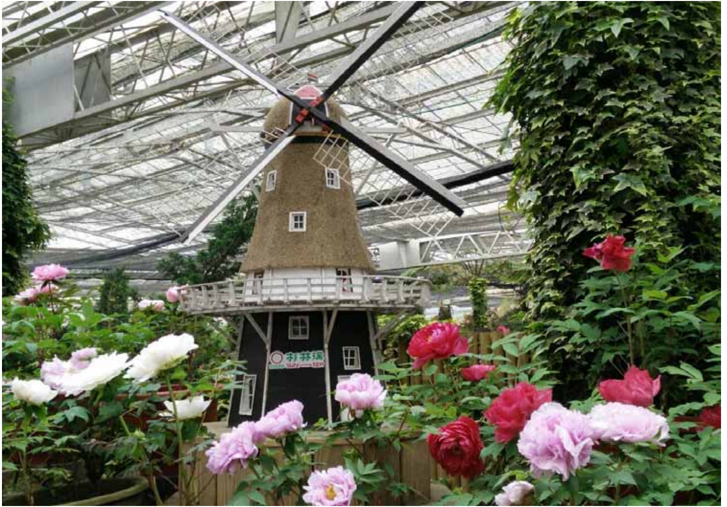
象徵富貴吉祥的牡丹花季，在杉林溪裡華麗登場