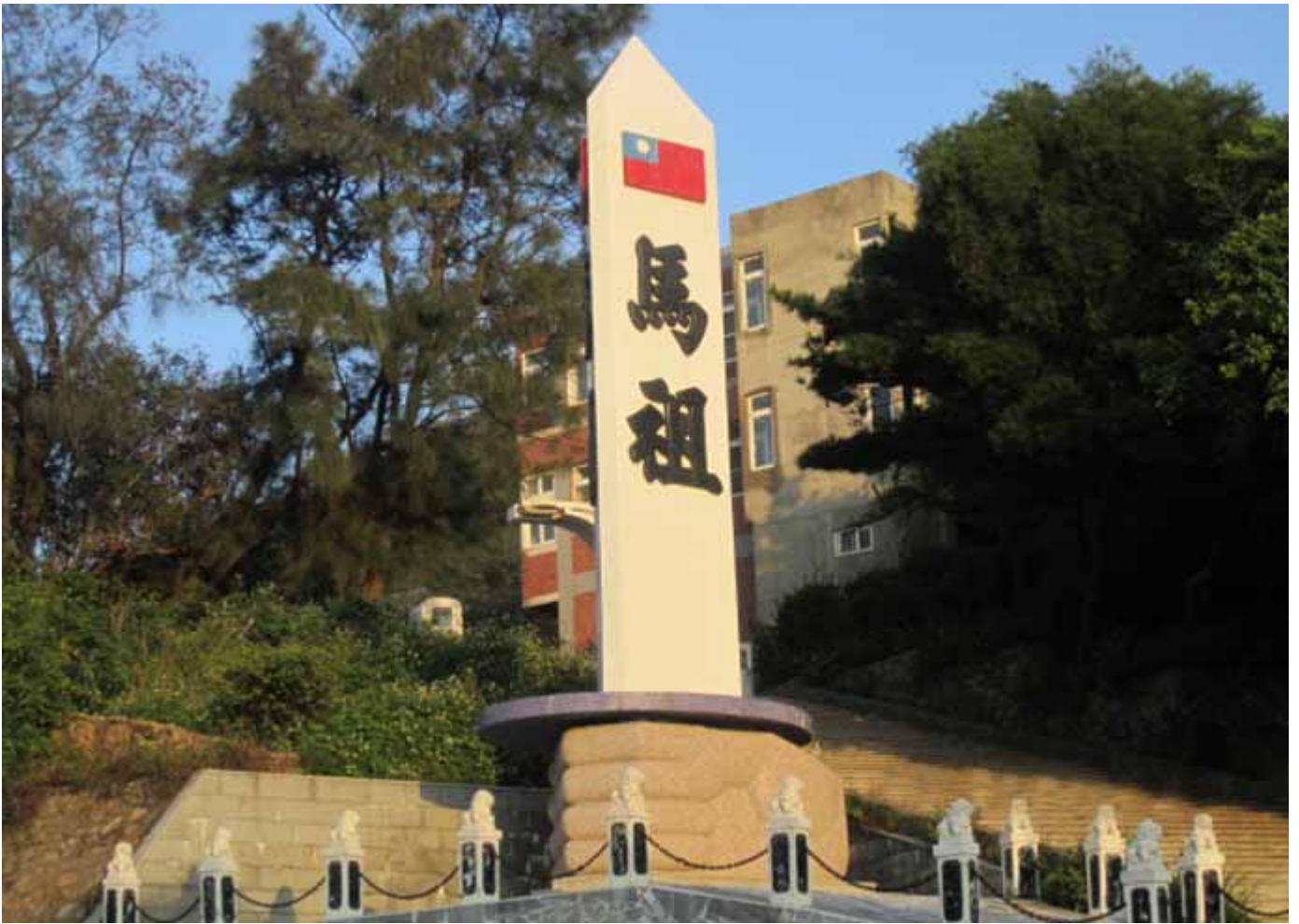
馬祖：閩江口的一顆明珠，保有純樸的閩東色彩