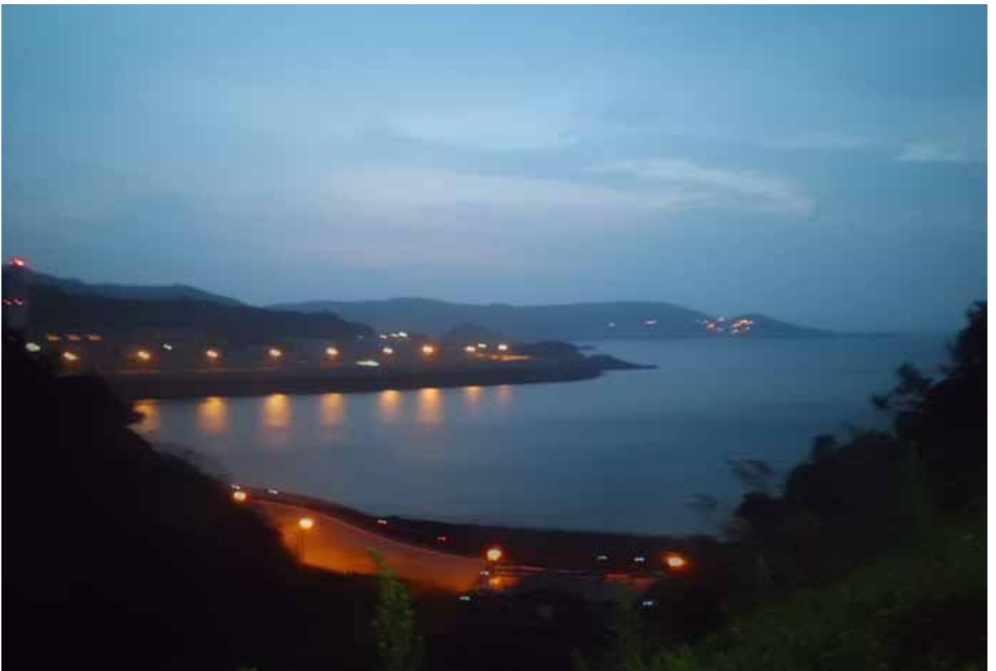
馬祖臨近東海，和中國大陸相距最近不到 10 海浬