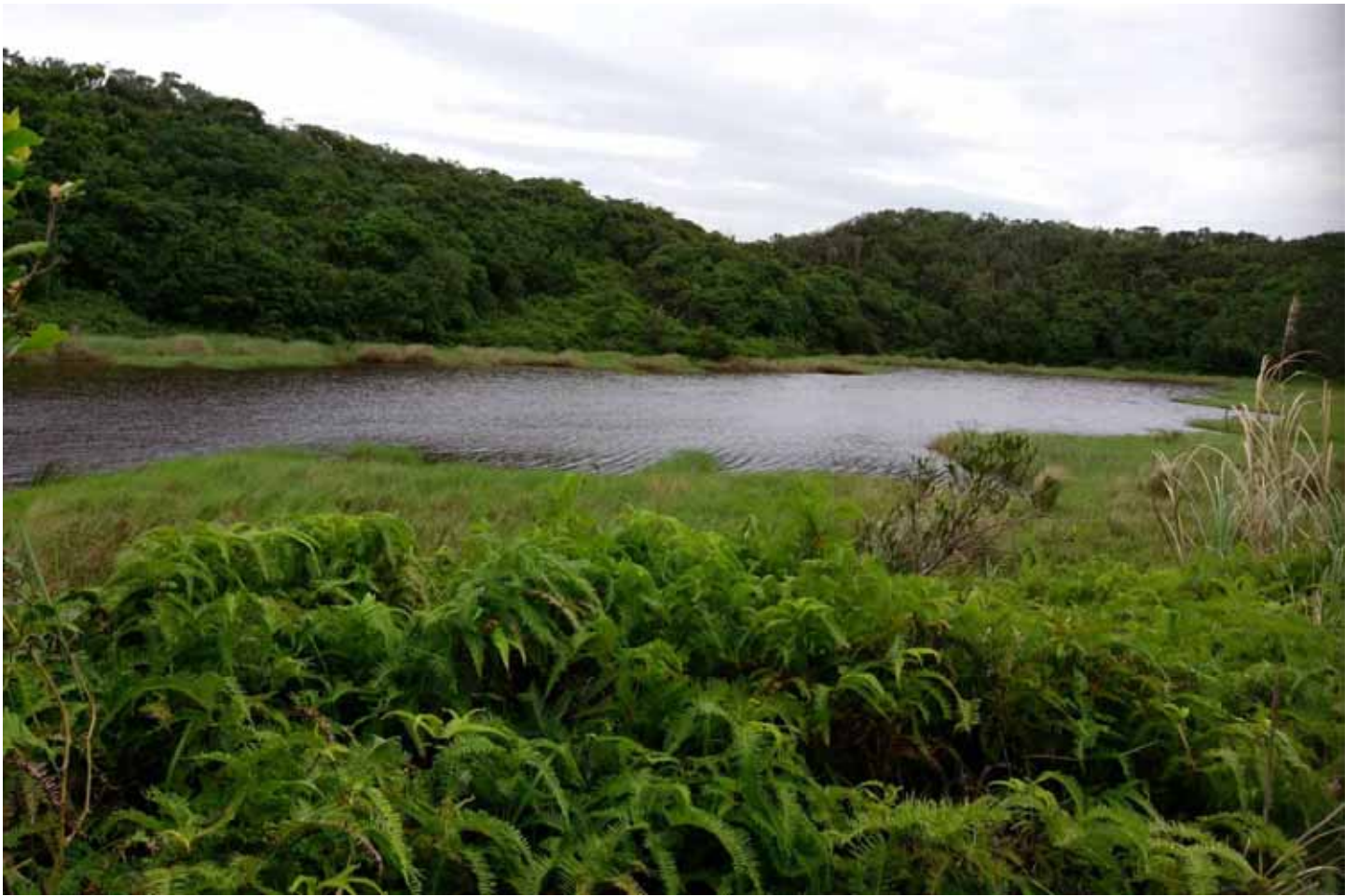
南仁山上的南仁湖，位於生態保護區，成了遠離塵囂的世外桃源