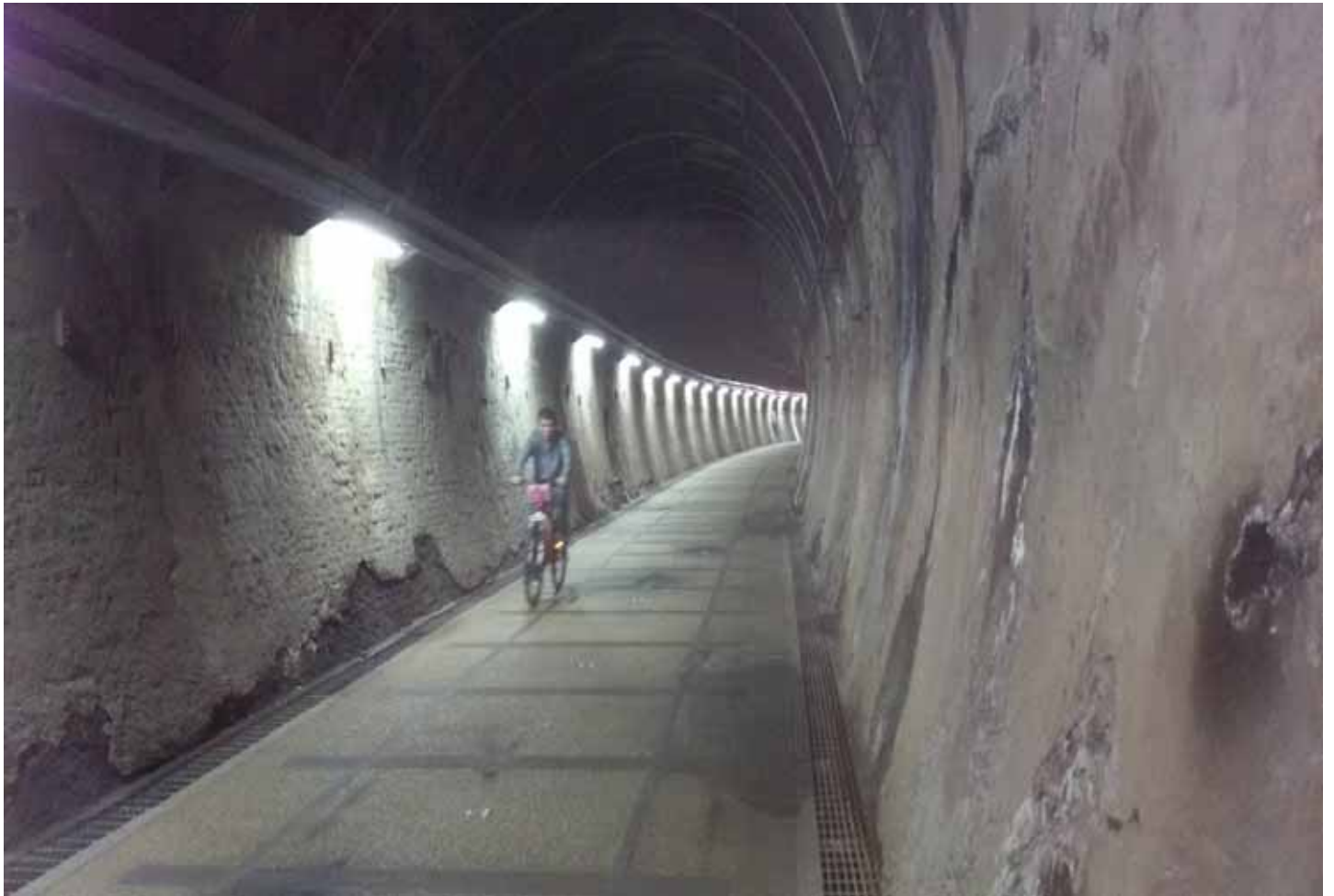
舊草嶺隧道是民謠”丟丟銅”中的磅空，興建工程極艱辛危險