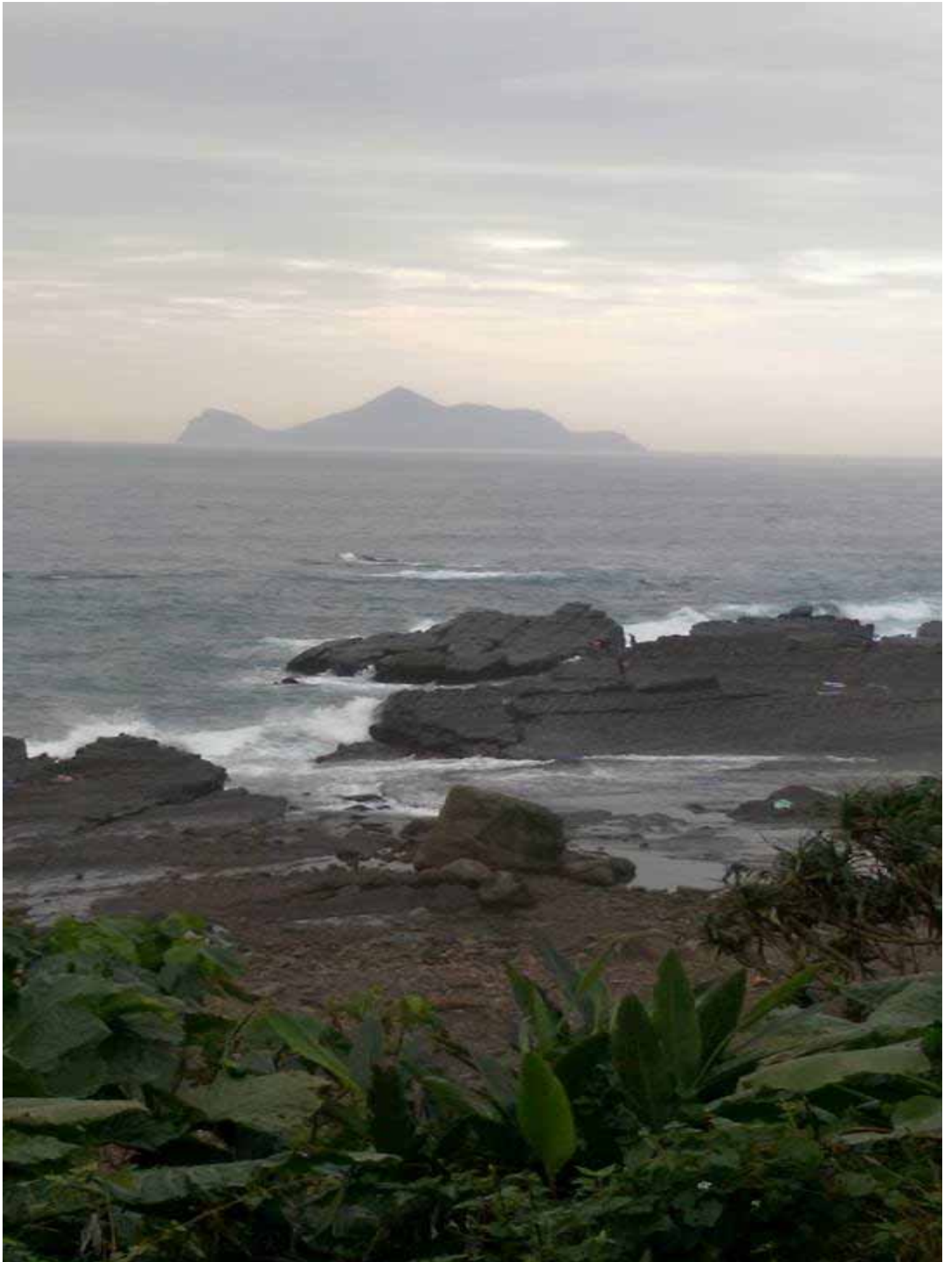
出了草嶺隧道遠眺龜山島，體會”台灣走透透，龜山走不透”的含意