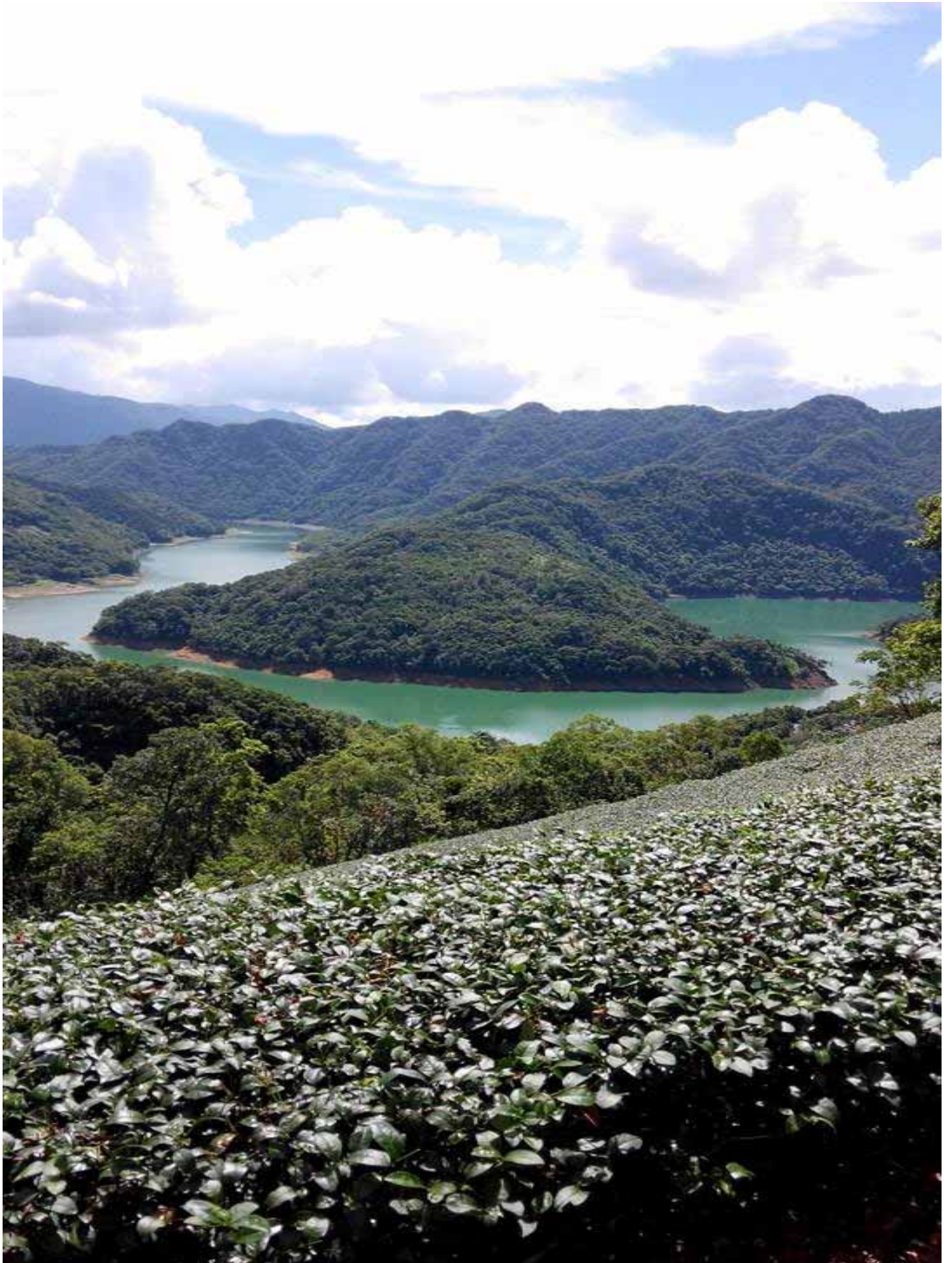
千島湖是台灣最美的秘境之一，搭配茶園，拍出絕美的山水照