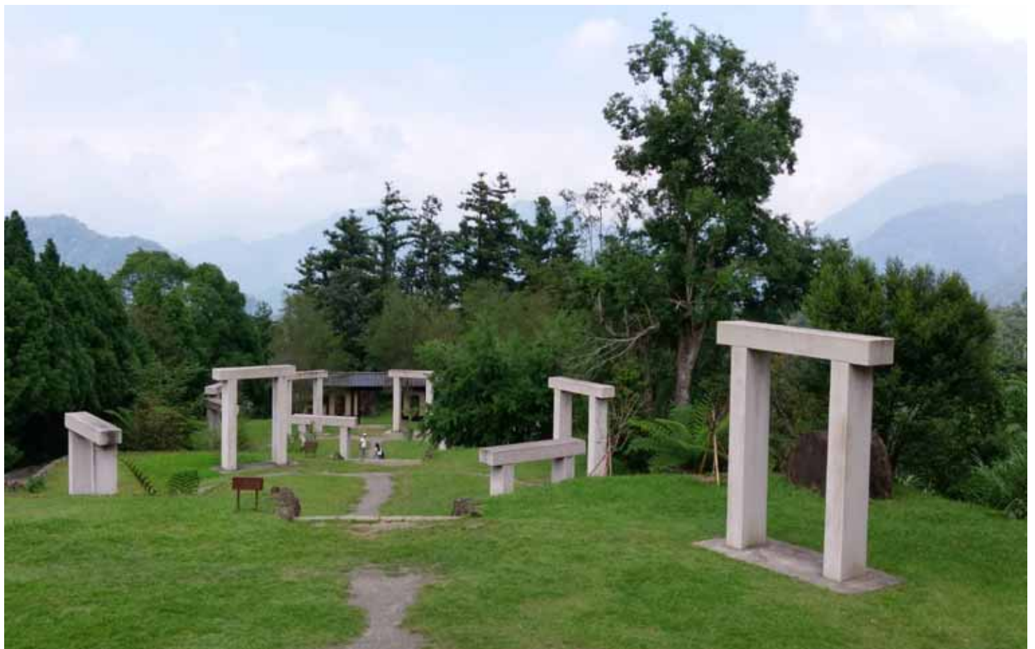
園區以易經理念，佈置八卦、四象、兩儀和太極亭，據說有無形能量