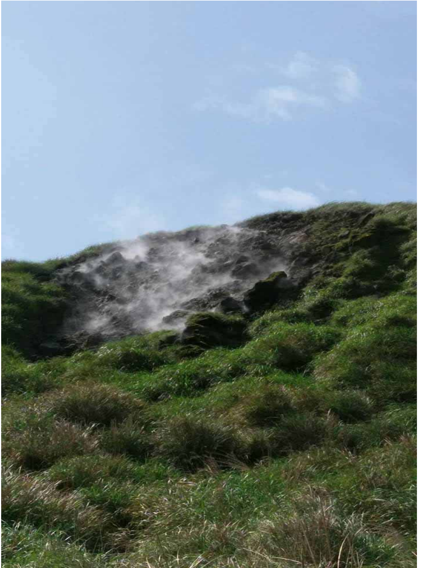
七星山位於大屯活火山群，陣陣硫磺味飄散在箭竹和芒草叢中