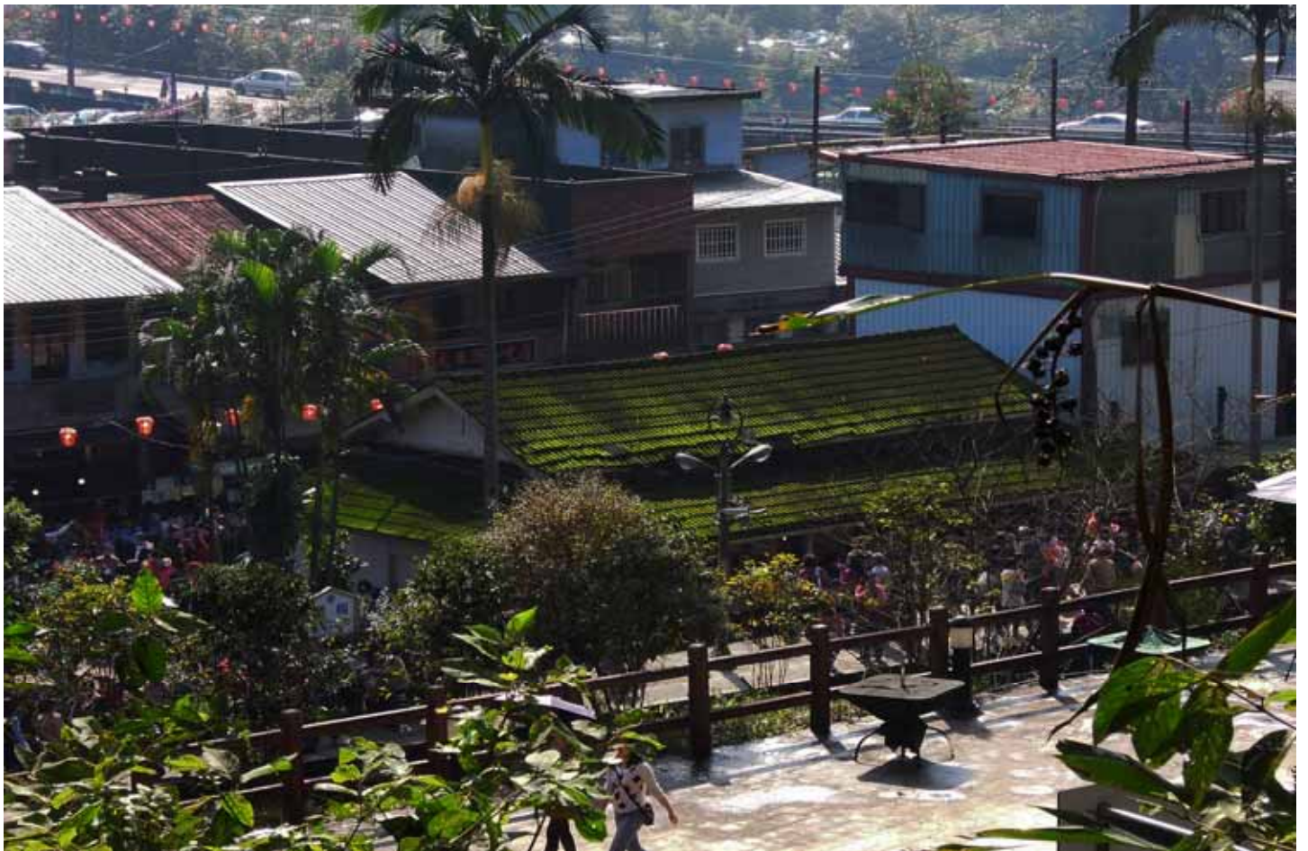
菁桐火車站是平溪線熱門的景點，不時可見天燈裊裊升空