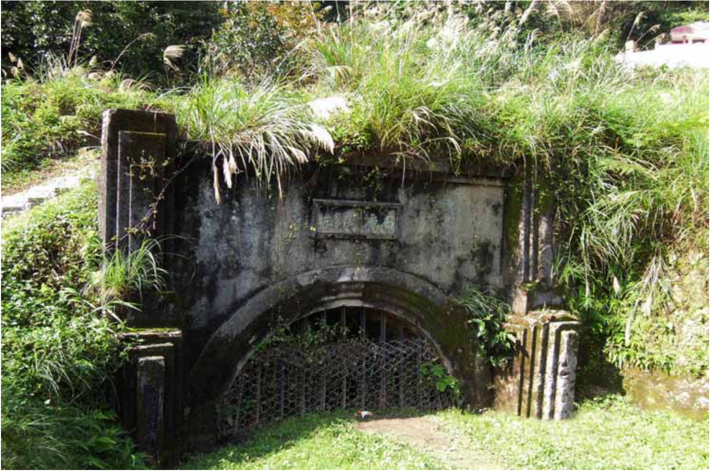
菁桐的”石底大斜坑”是荒蕪中的煤礦歷史痕跡