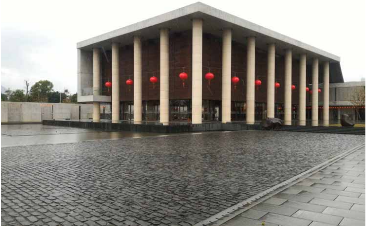
法鼓山農禪寺”水月道場”，有著特殊建築型式，水月池宛如明鏡的風采