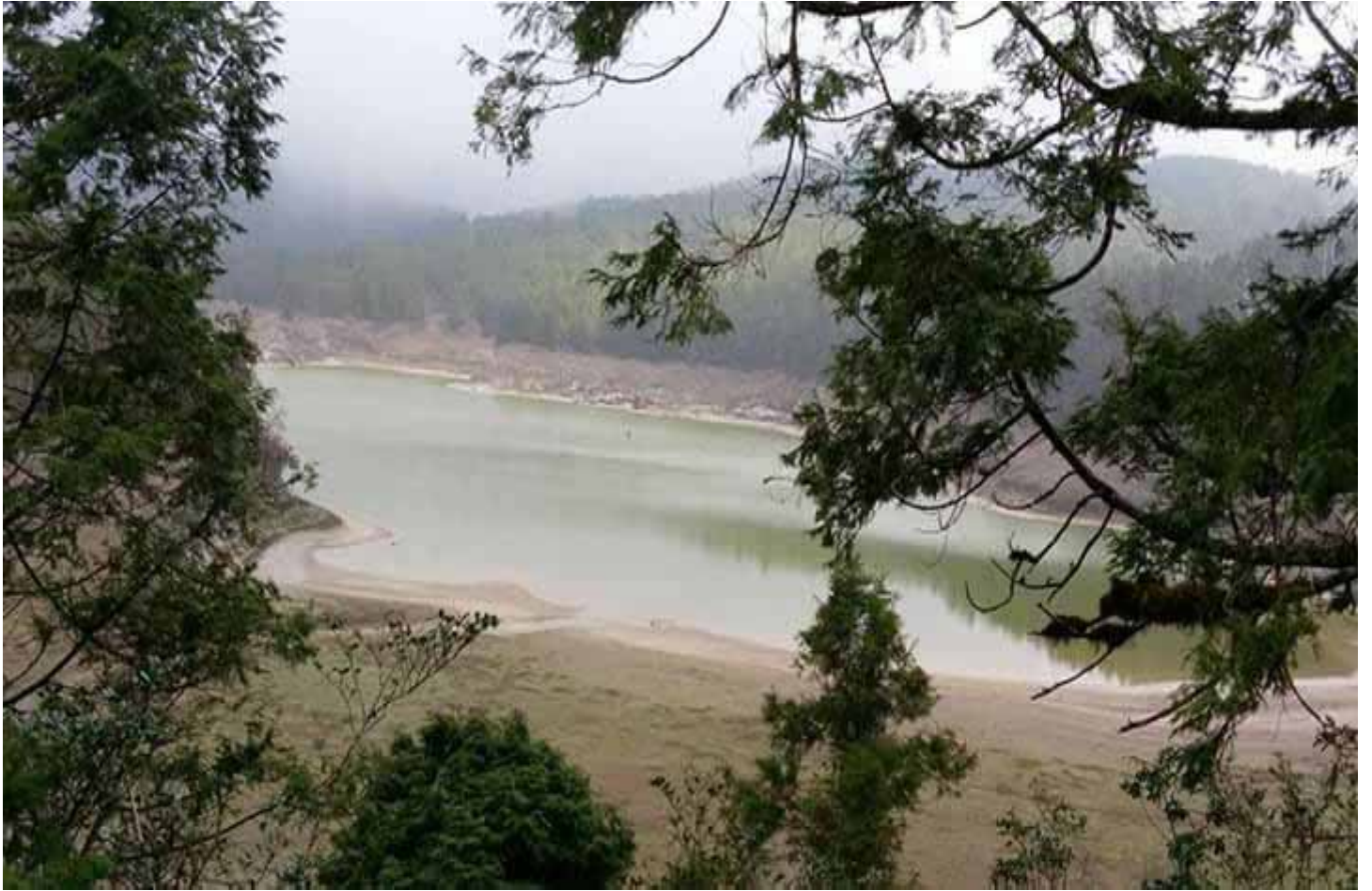
翠峰湖的美，像蒙上面紗的的少女，時而浪漫，時而神秘