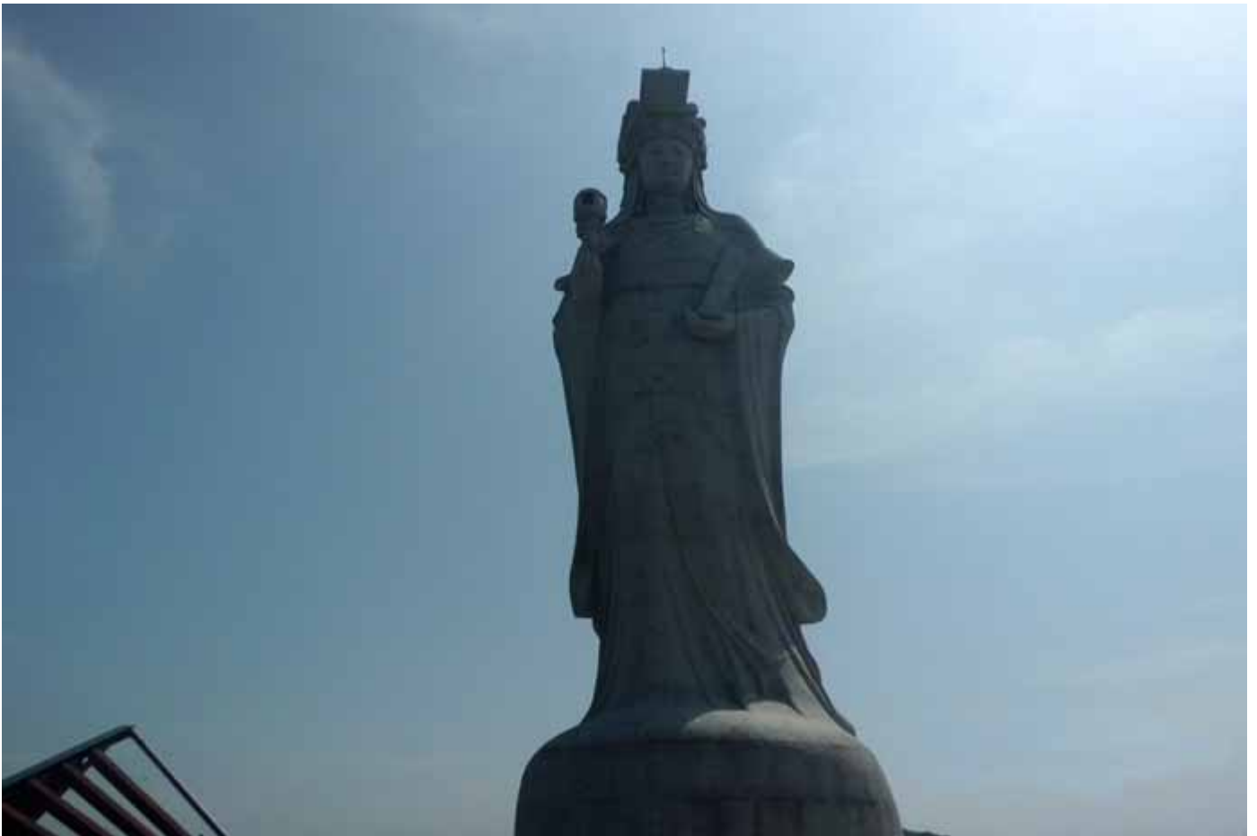
媽祖巨神像：由 365 塊花崗岩所刻，象徵 " 日日平安 "