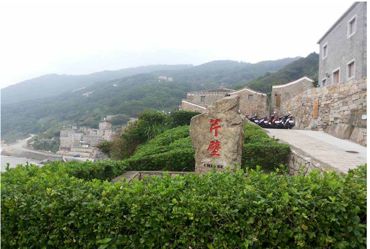
北竿 芹壁：閩東特色的印章屋，依山而建，有著"馬祖地中海"的美名