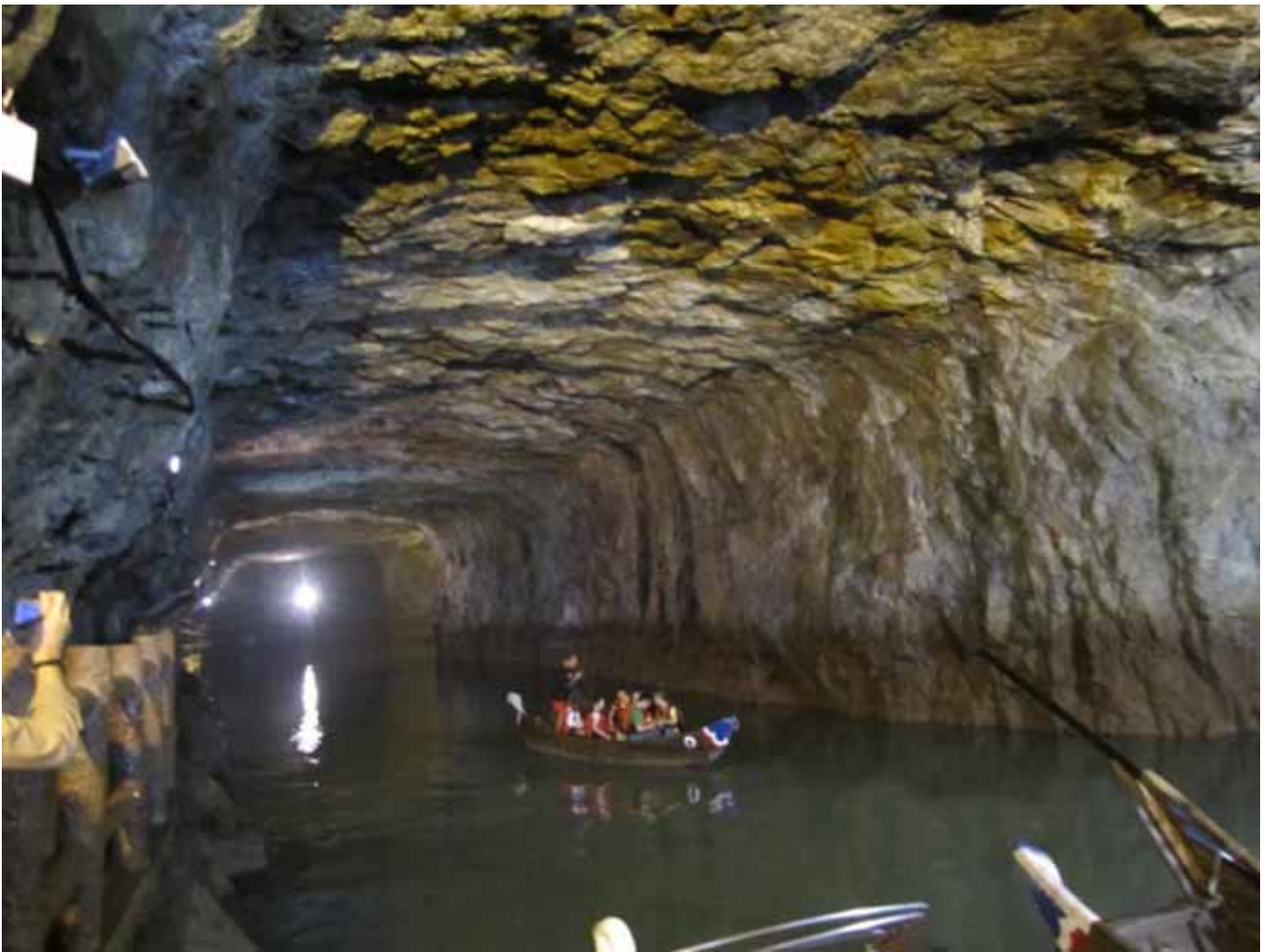
地下堡壘 北海坑道，是欣賞藍眼淚最佳的場所