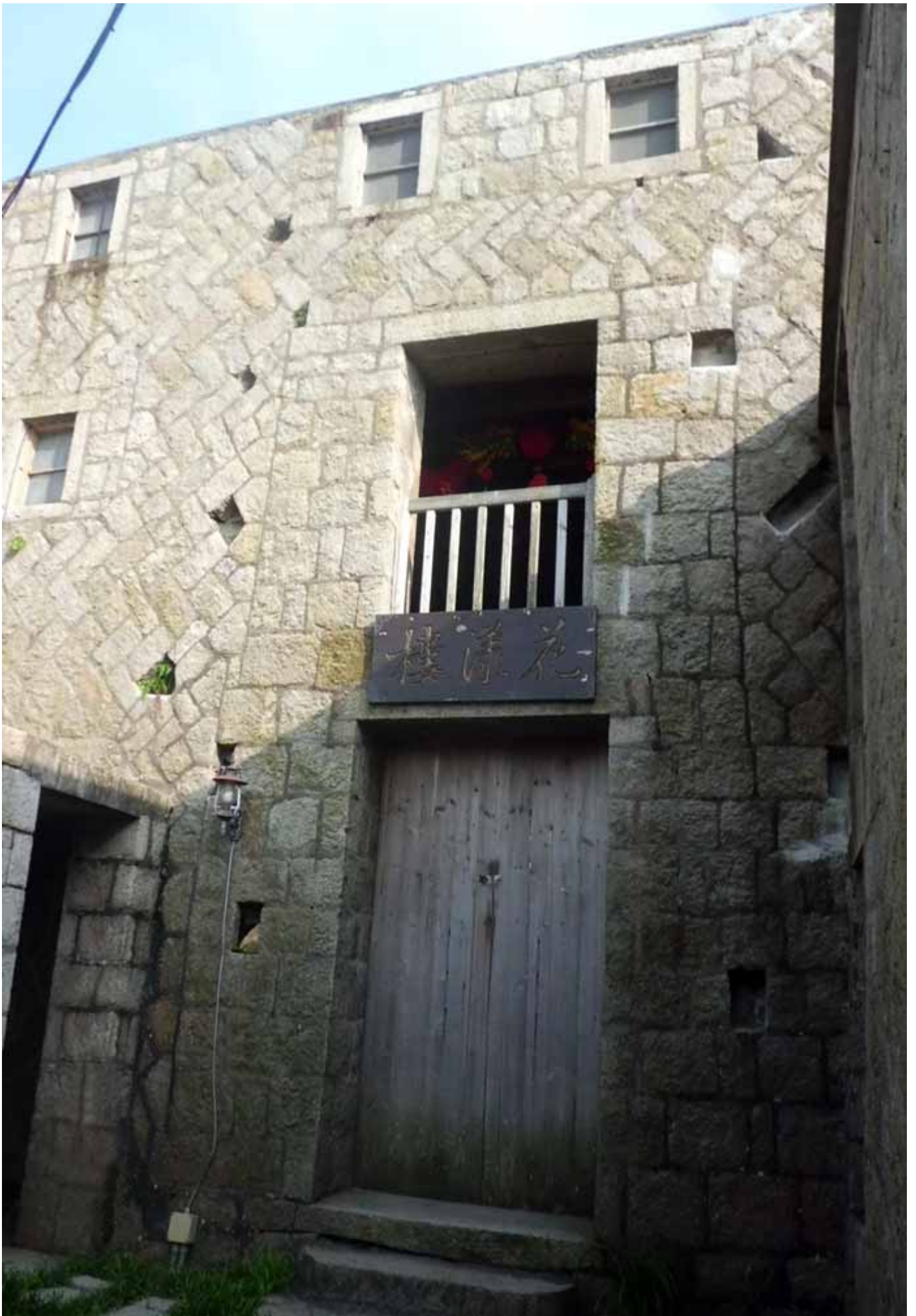
人字形和丁字形牆面，象徵人丁興旺