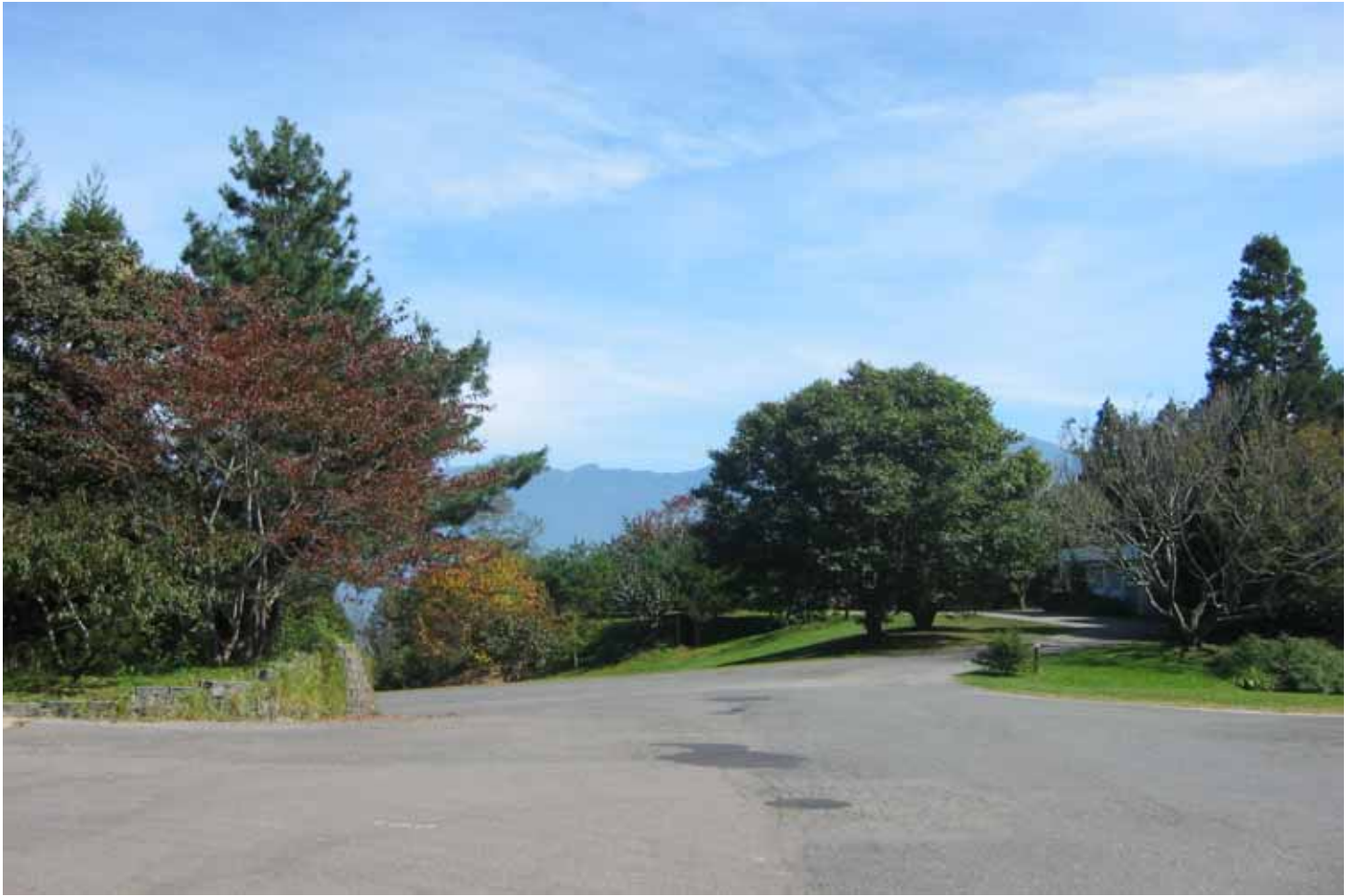
在海拔 2100 公尺的梅峰農場住上一晚，可以參加夜間觀星活動