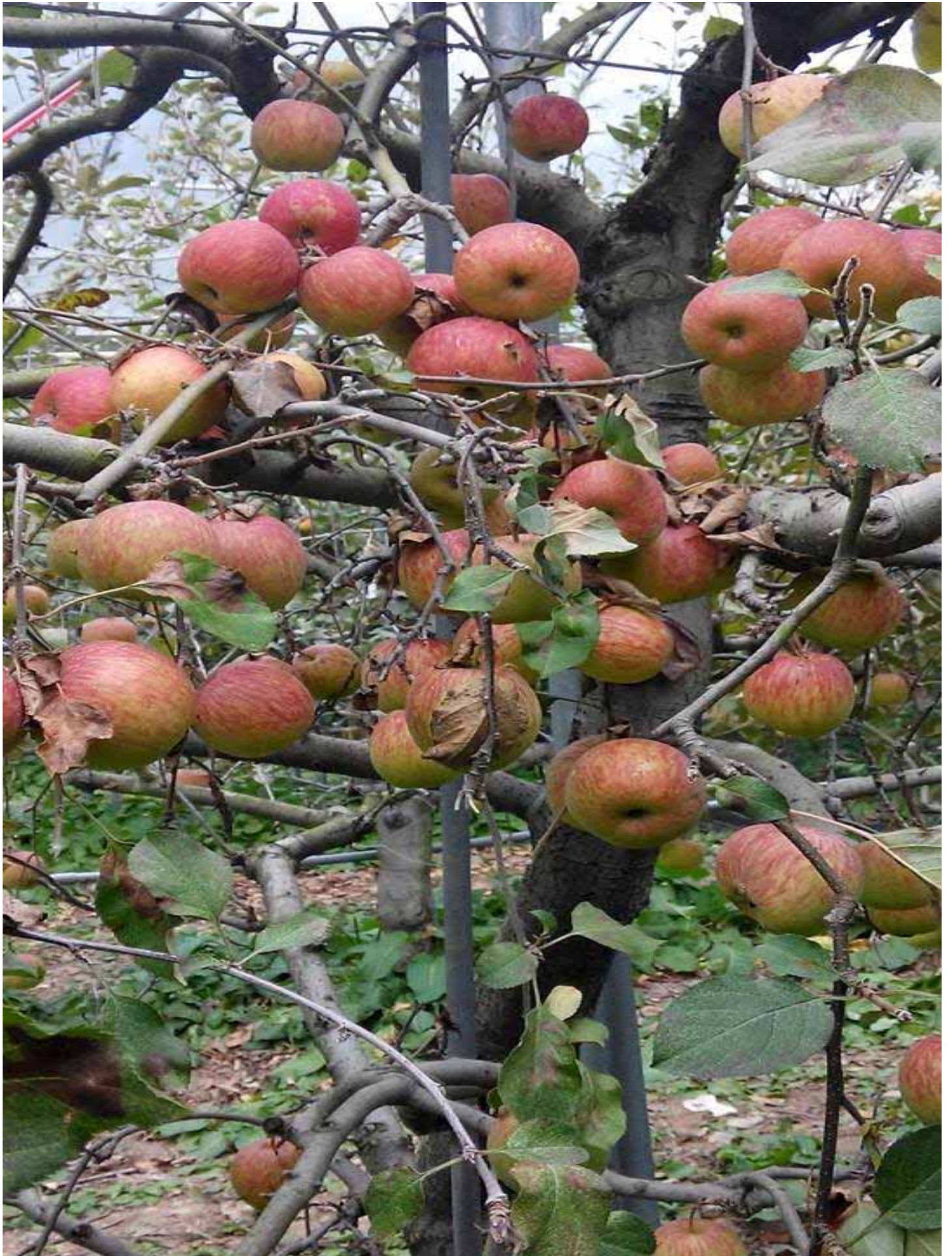
在結實纍纍的蘋果樹下 " 採蘋果 " ，是此次活動的高潮、有趣體驗