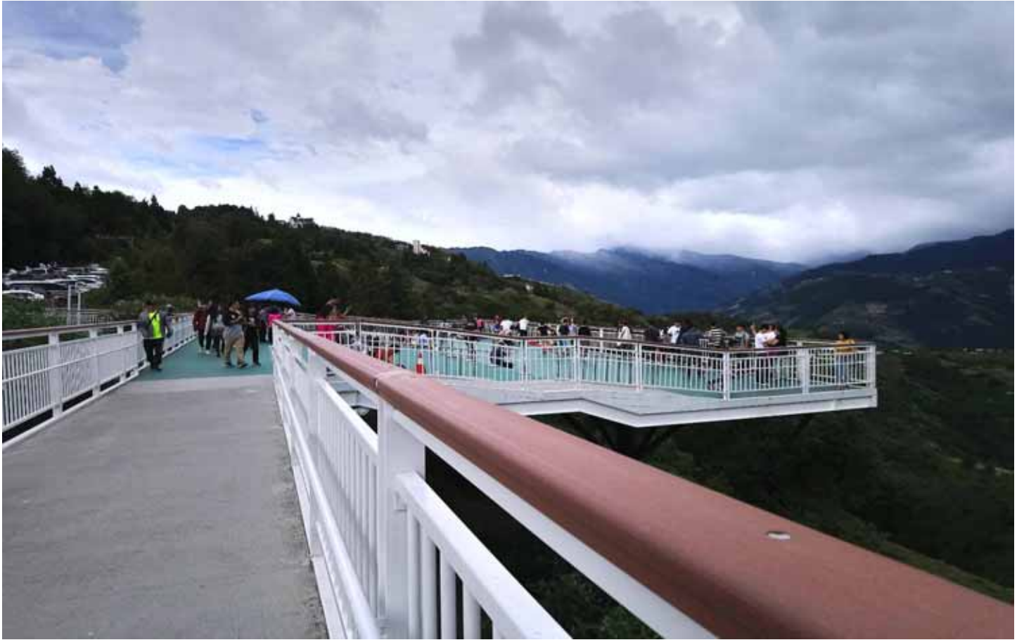
清境高空景觀步道，放眼群山如帶、深谷千米