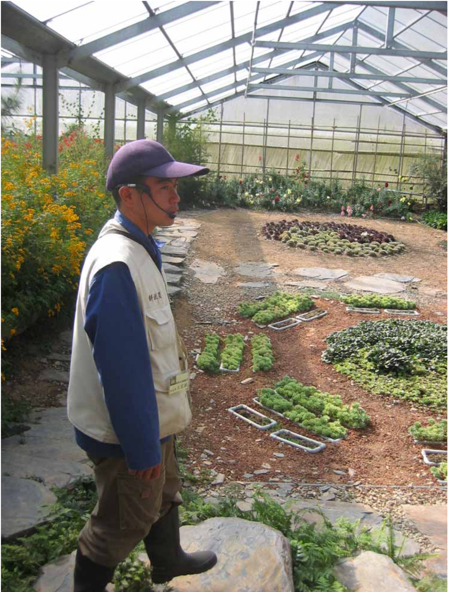
農場裡多屬都市少見的溫帶花卉，有專業的導覽員精闢解說