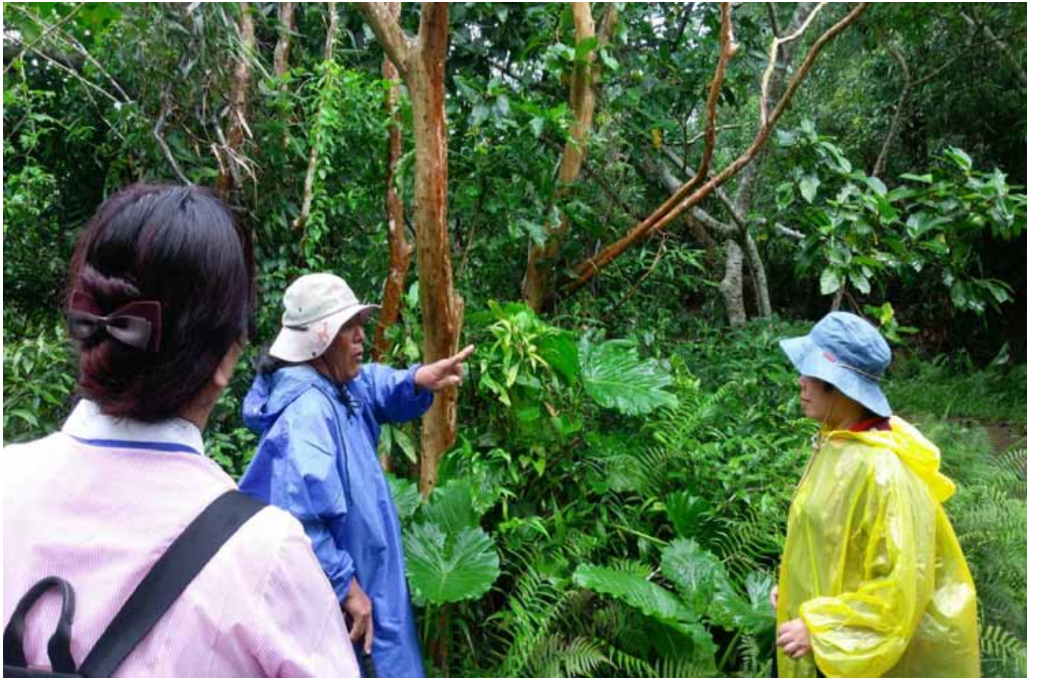
專業生態解說員，精闢介紹中海拔才得以見到的植物、蝴蝶、蝸牛...