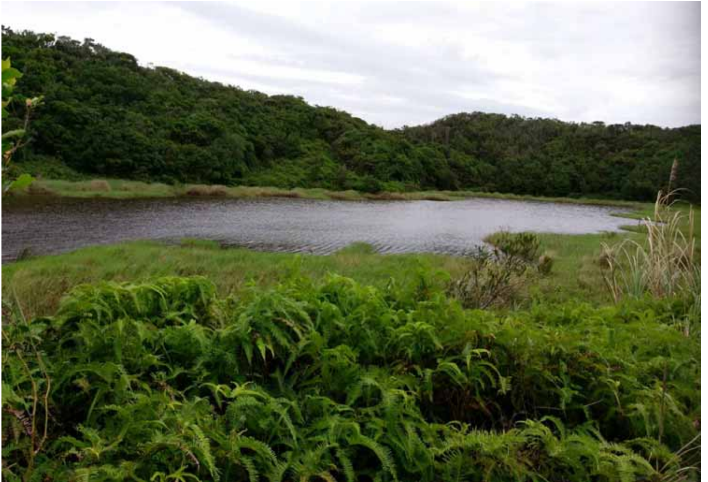
南仁山上的南仁湖，位於生態保護區，成了遠離塵囂的世外桃源