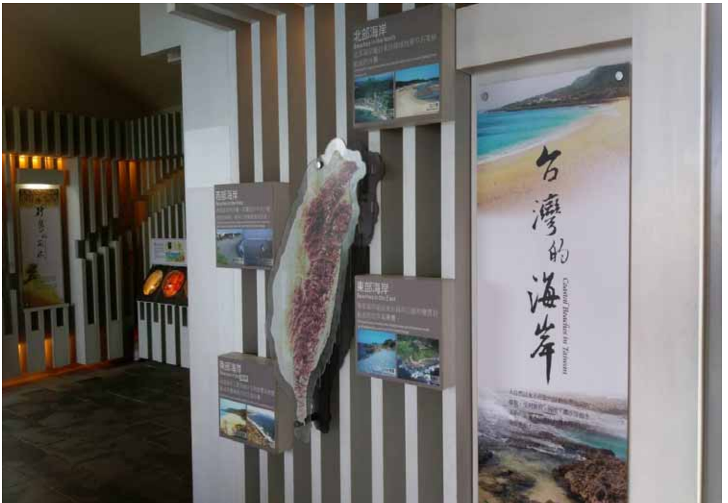
貝殼砂展示館，清楚解說貝殼砂的形成，看到顯微鏡下美麗的形影