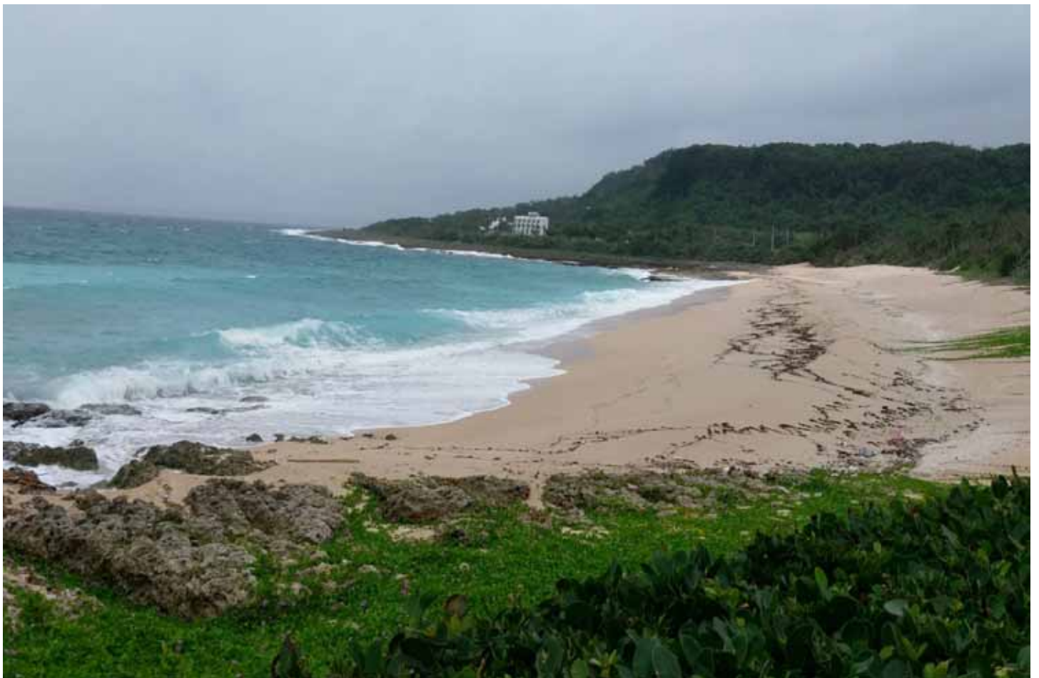
砂島沙灘的貝殼砂含量高達近 98%，高居全台之冠