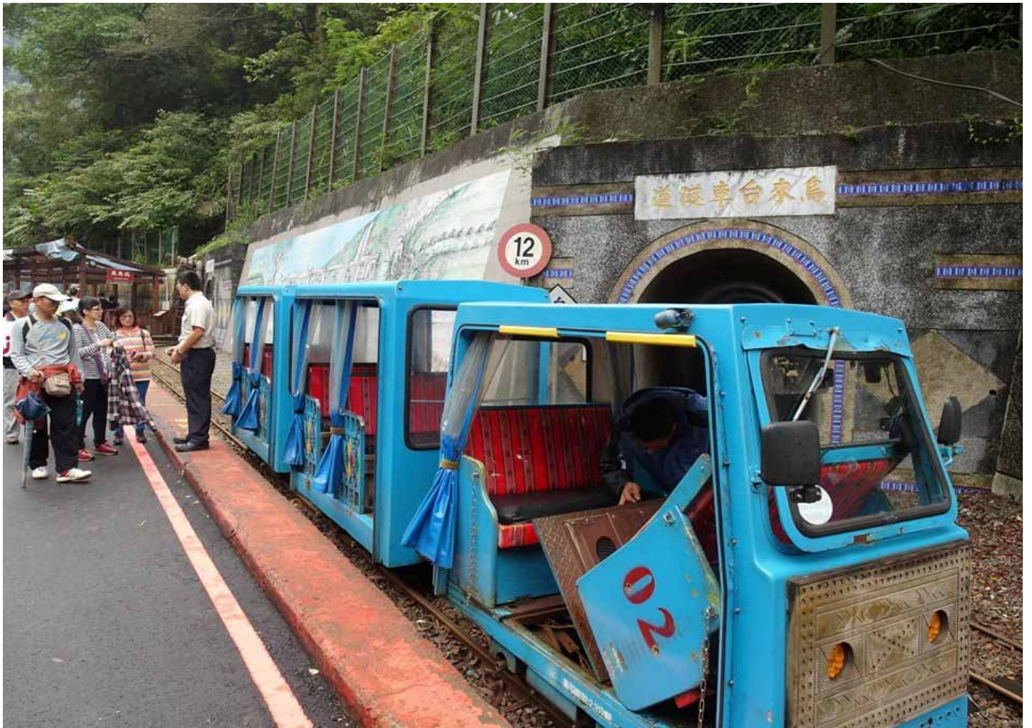
烏來的台車是日治時期的運材車，以人力推動，軌道是呈斜坡狀設計