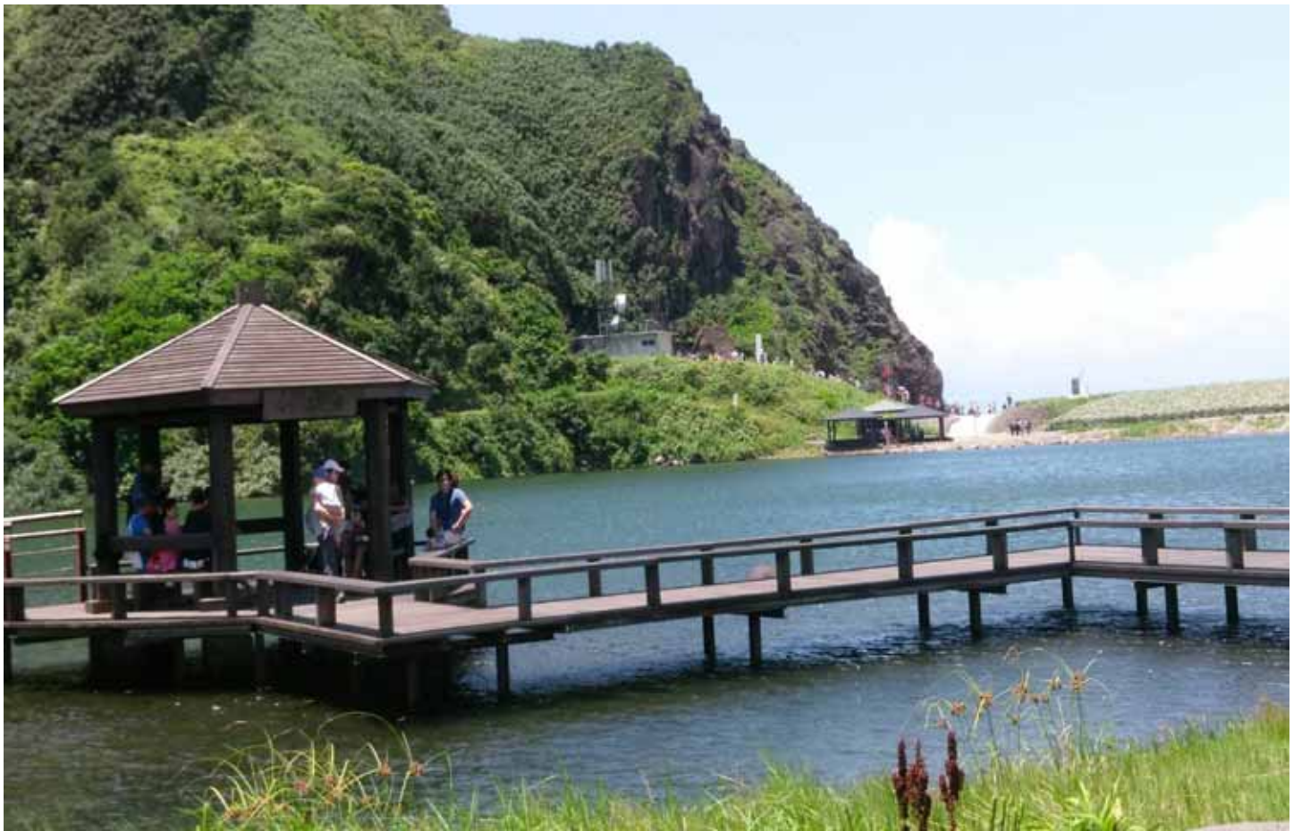
龜尾湖是島上最美的景點之一，沿著湖畔漫遊欣賞美麗的湖光山色