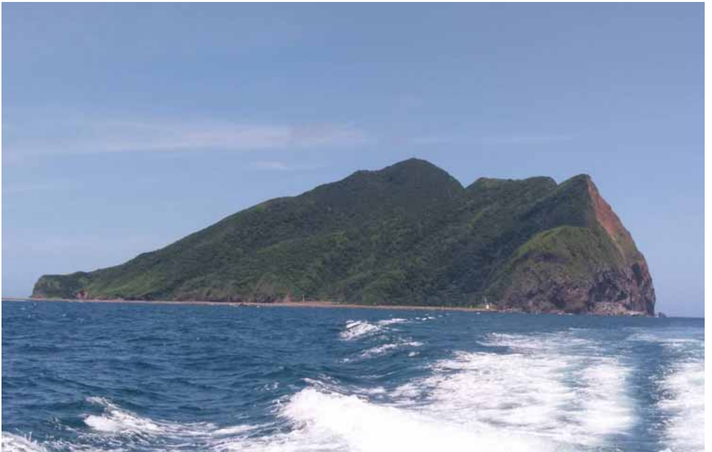
龜山島是蘭陽平原外海、太平洋上的一顆明珠