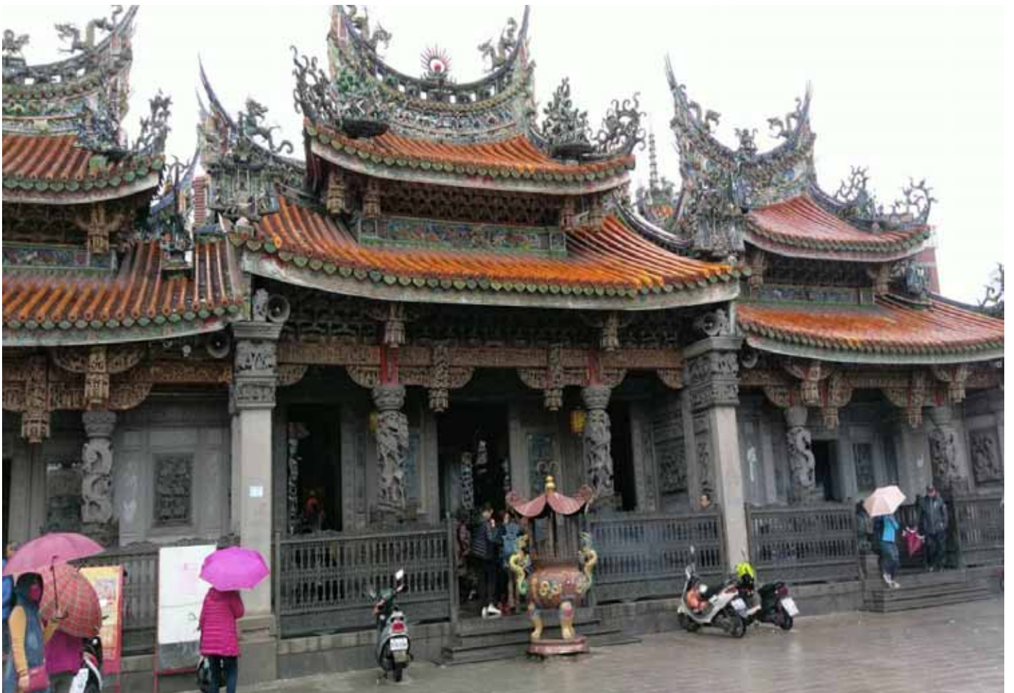
李梅樹大師畢生心血結晶的清水祖師廟，有 " 東方的藝術殿堂之美譽