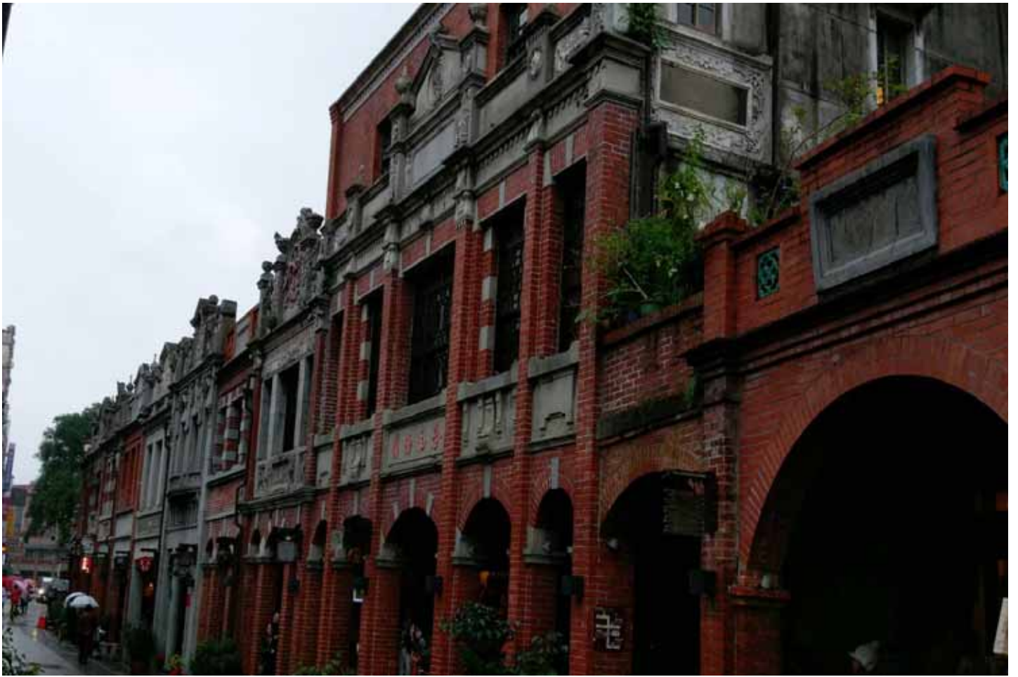
舊名 "三角湧" 的三峽老街，因河港轉運茶葉、藍染，造就繁華榮景