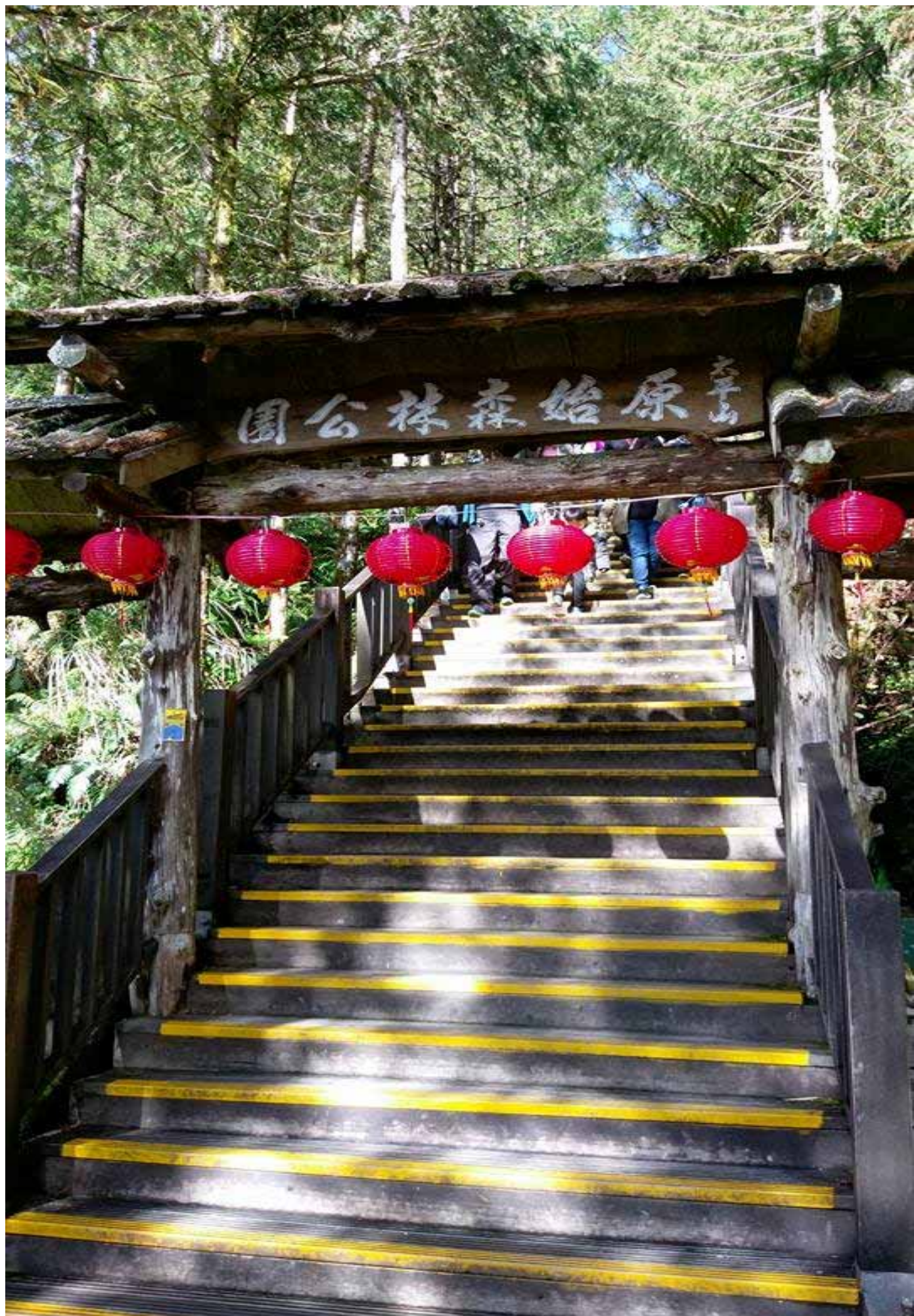
位於海拔 2000 公尺的原始森林