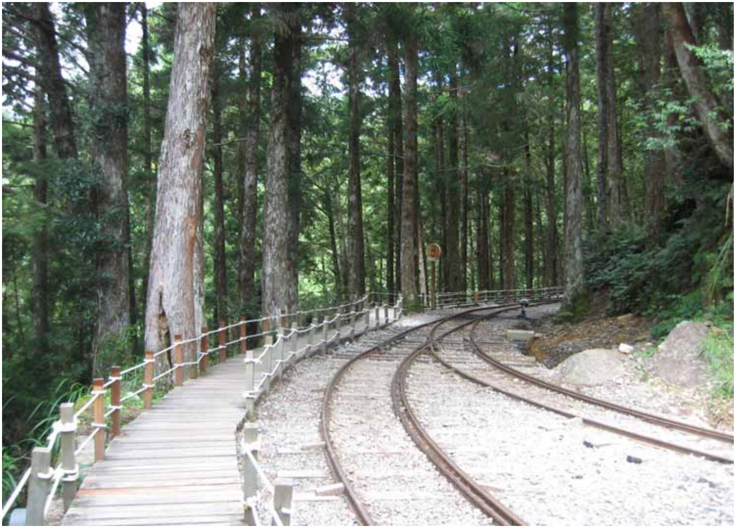
昔日運送木材的五分車鐵路