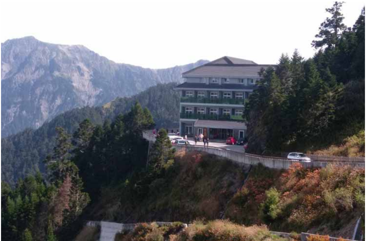
合歡山遠眺黑色奇萊山