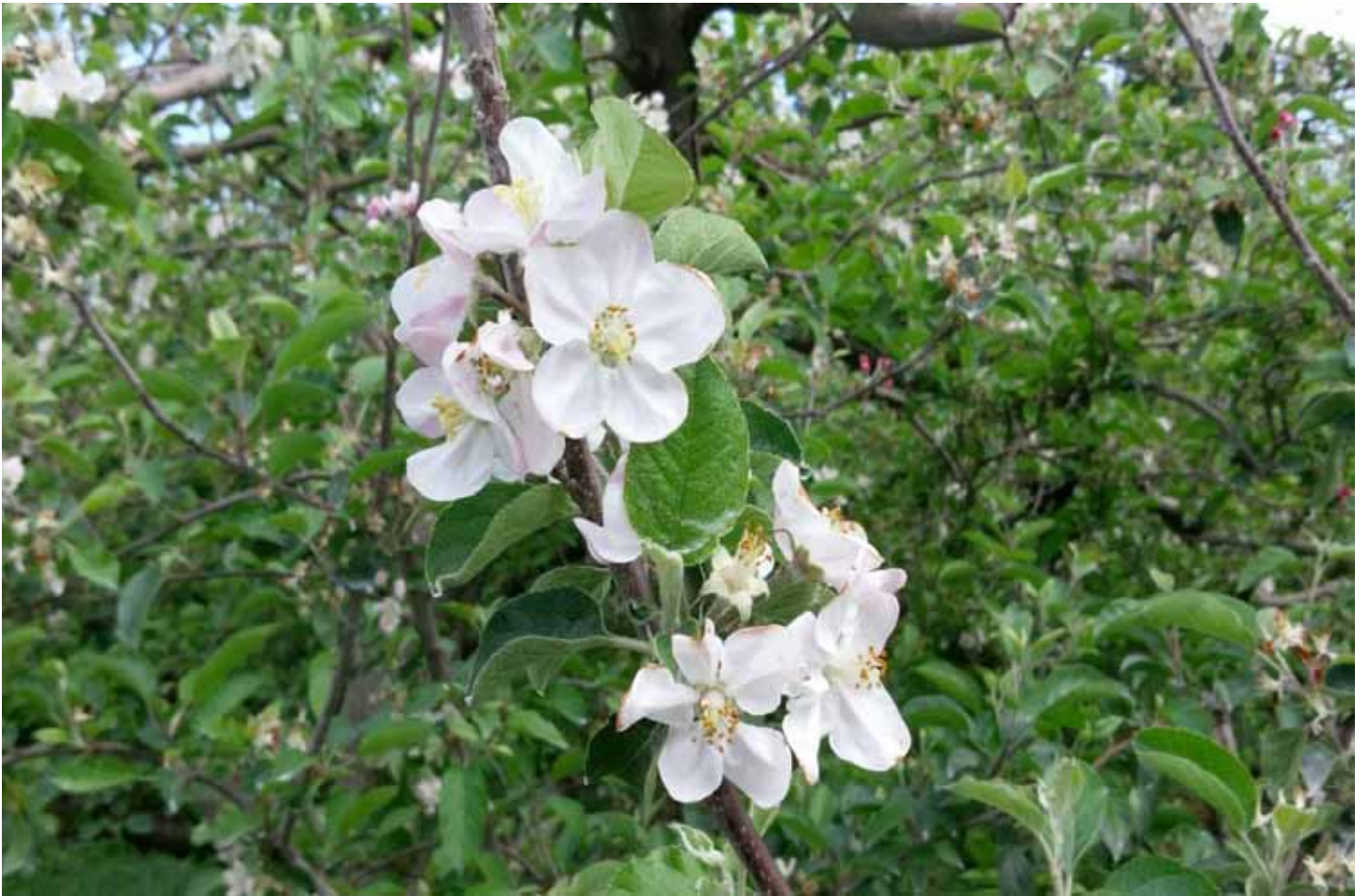
四月賞蘋果花，朵朵嬌豔綻放