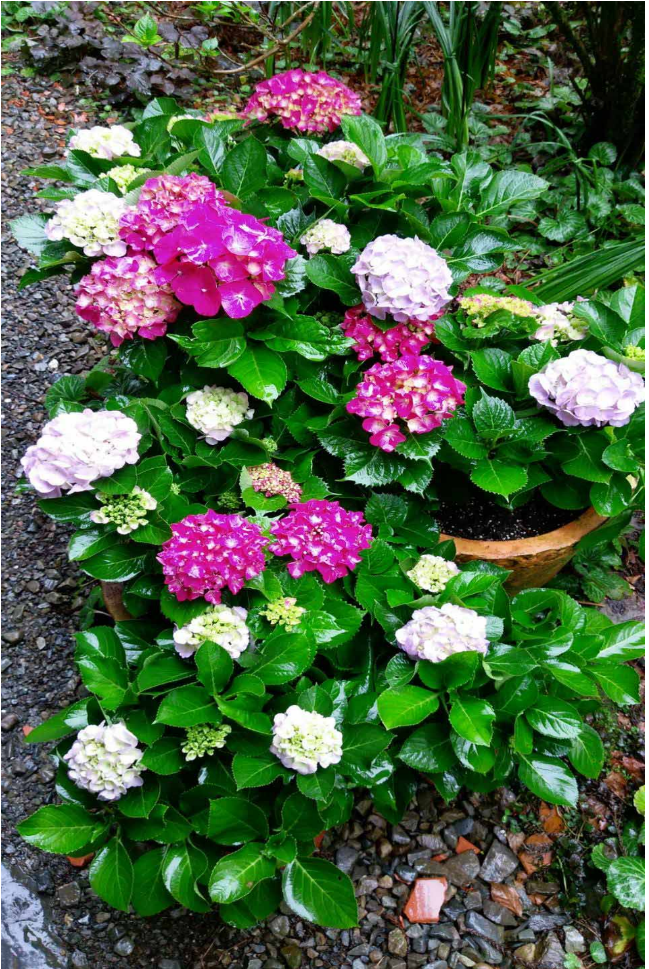
美麗的繡球花，在霧氣瀰漫的杉林溪，展現千姿百態