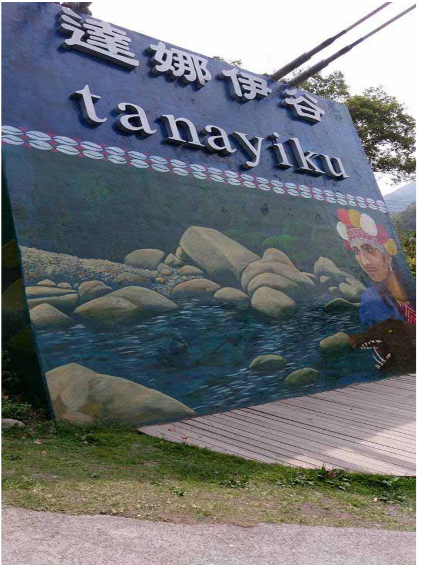
位於阿里山半山腰的達娜伊谷,是最具特色的鄒族部落