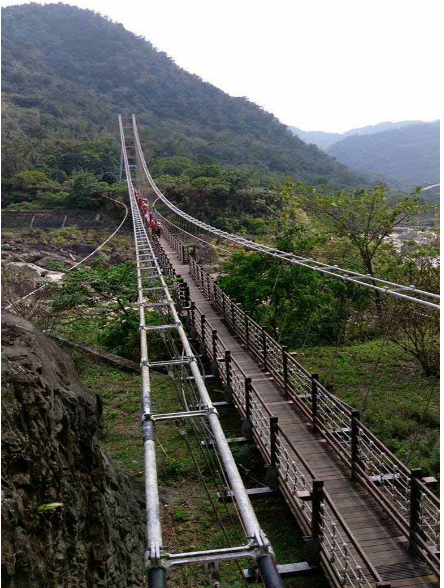
歷經風災重建的達娜伊谷橋，橋下孕育著俗稱 " 苦花 " 的高鯽魚