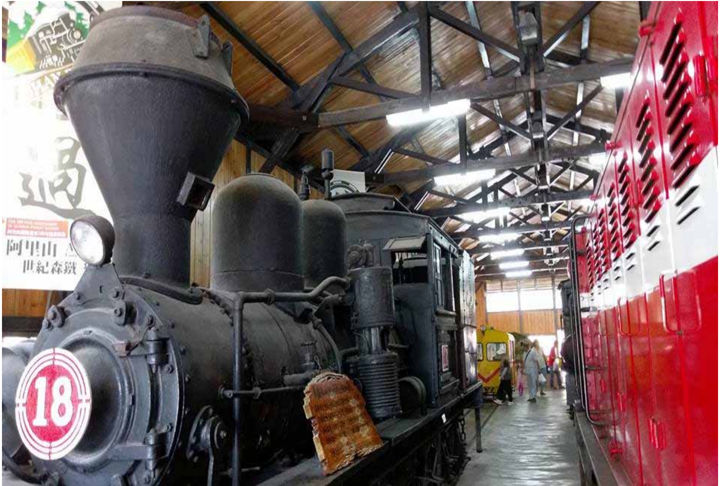
奮起湖過去是阿里山森林鐵路的中繼站