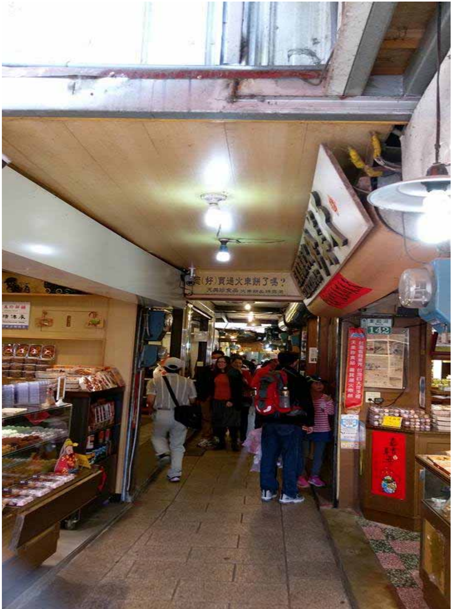
擁有許多老字號商店的奮起湖老街