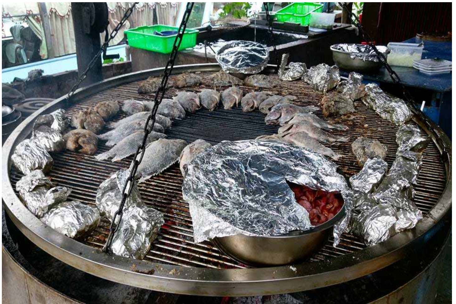
總令人垂涎三尺的原住民風味餐