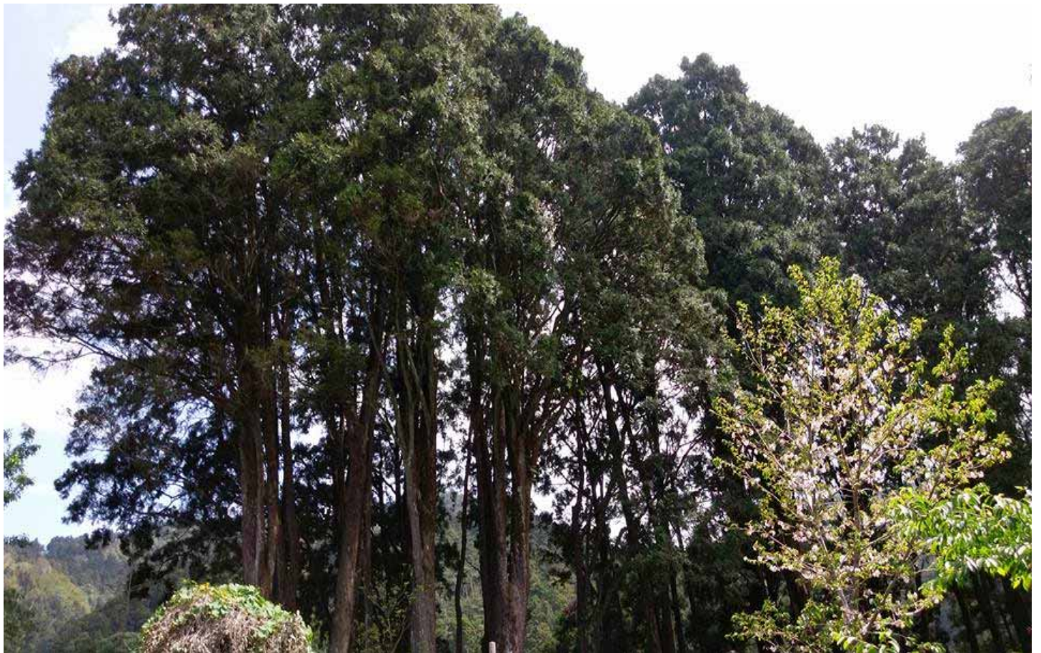
奮起湖老街，高聳挺拔肖楠林