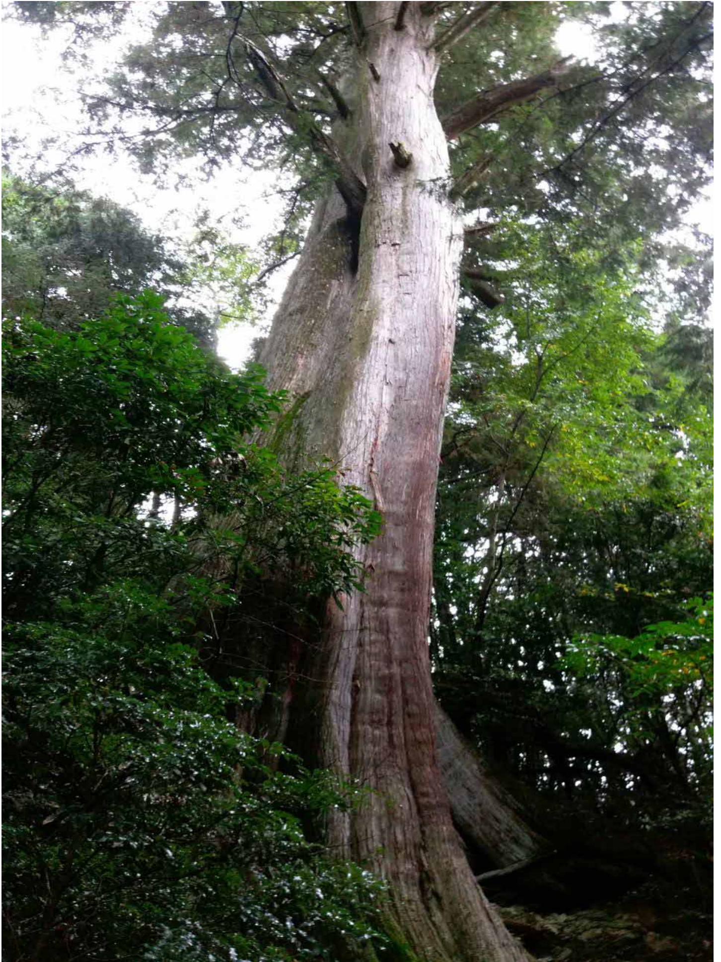
位於雪霸國家公園裡的觀霧，擁有千年紅檜、扁柏珍貴巨木