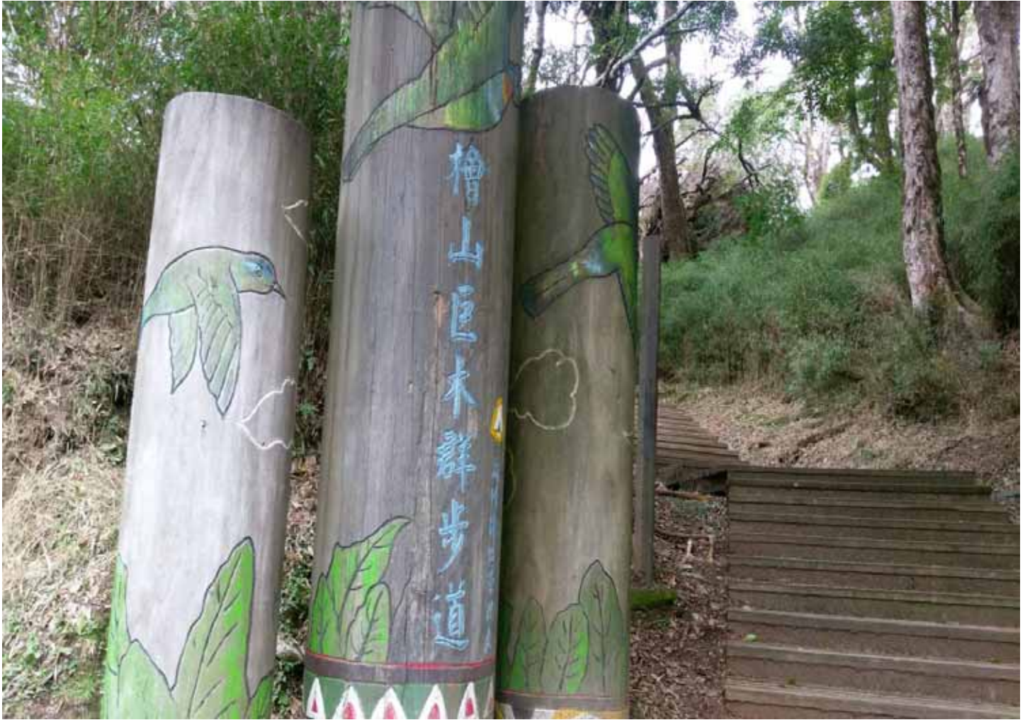
檜山巨木群步道落差不大、好走，沿途山色迷人，晴朗時可見和鵝公髻山和五指山