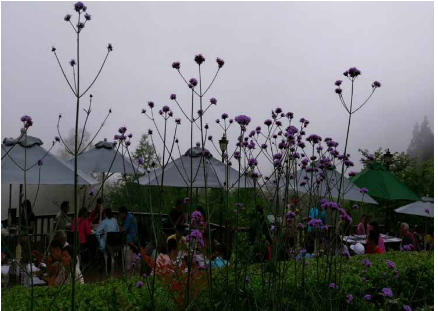
海拔 1200 公尺，山嵐無時飄落，享受宛如仙境的用餐環境