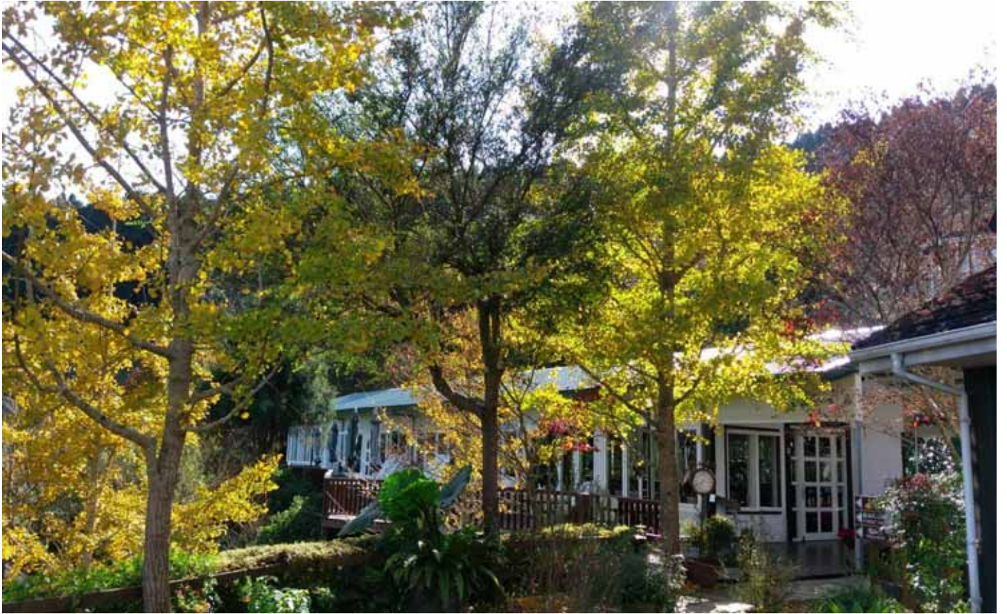
山上人家鄰近五峰鄉鵝公髻山，是遠離塵囂、渡假放鬆的最佳選擇