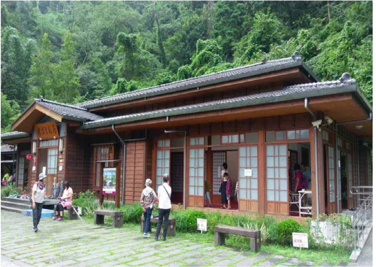
張學良故居：山居幽處境，舊雨引心寒。輾轉眠不得，枕上淚難乾