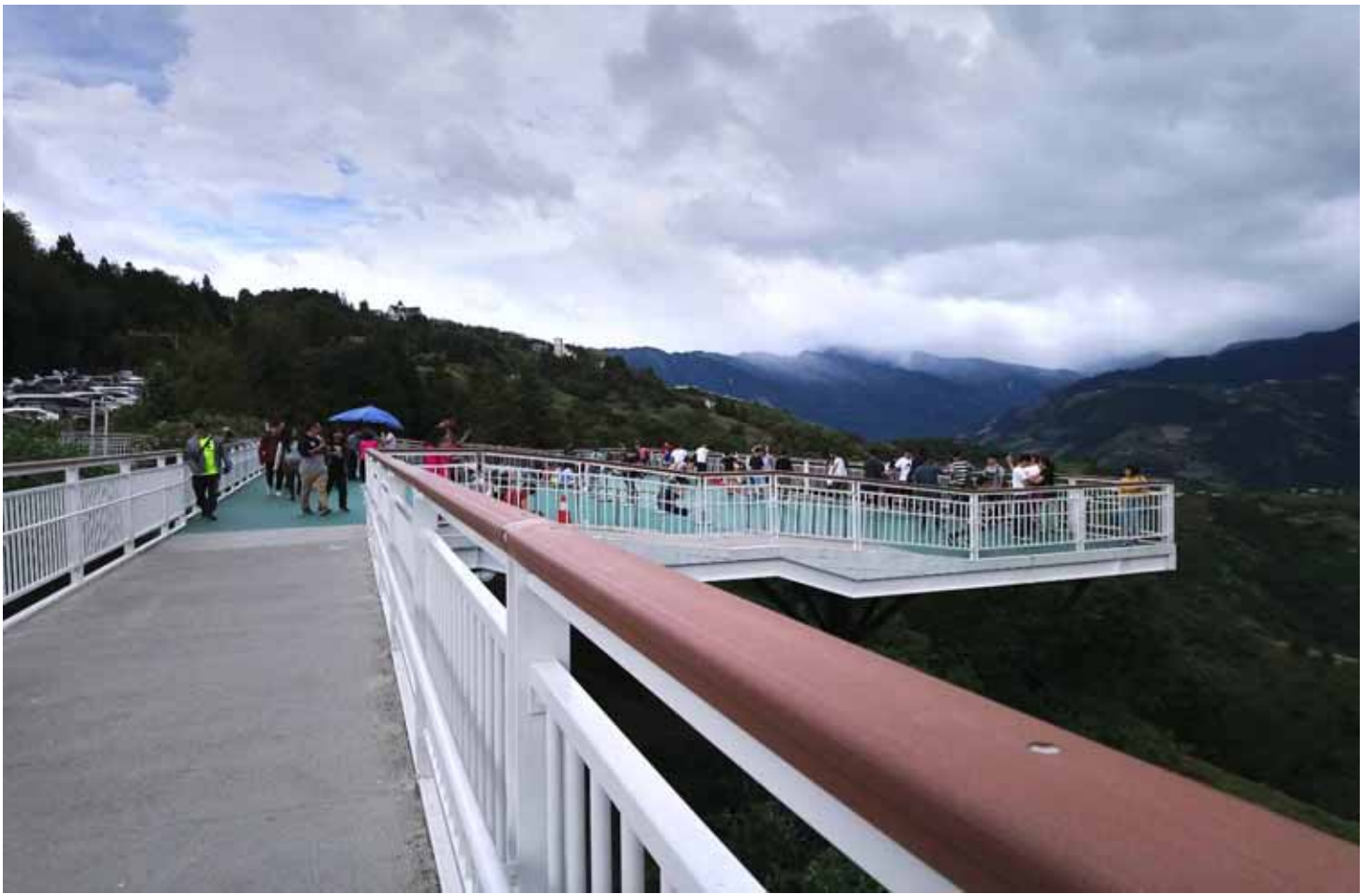
海拔 1700 公尺景觀步道，，是全台最高的高空步道，盡覽山脈群峰