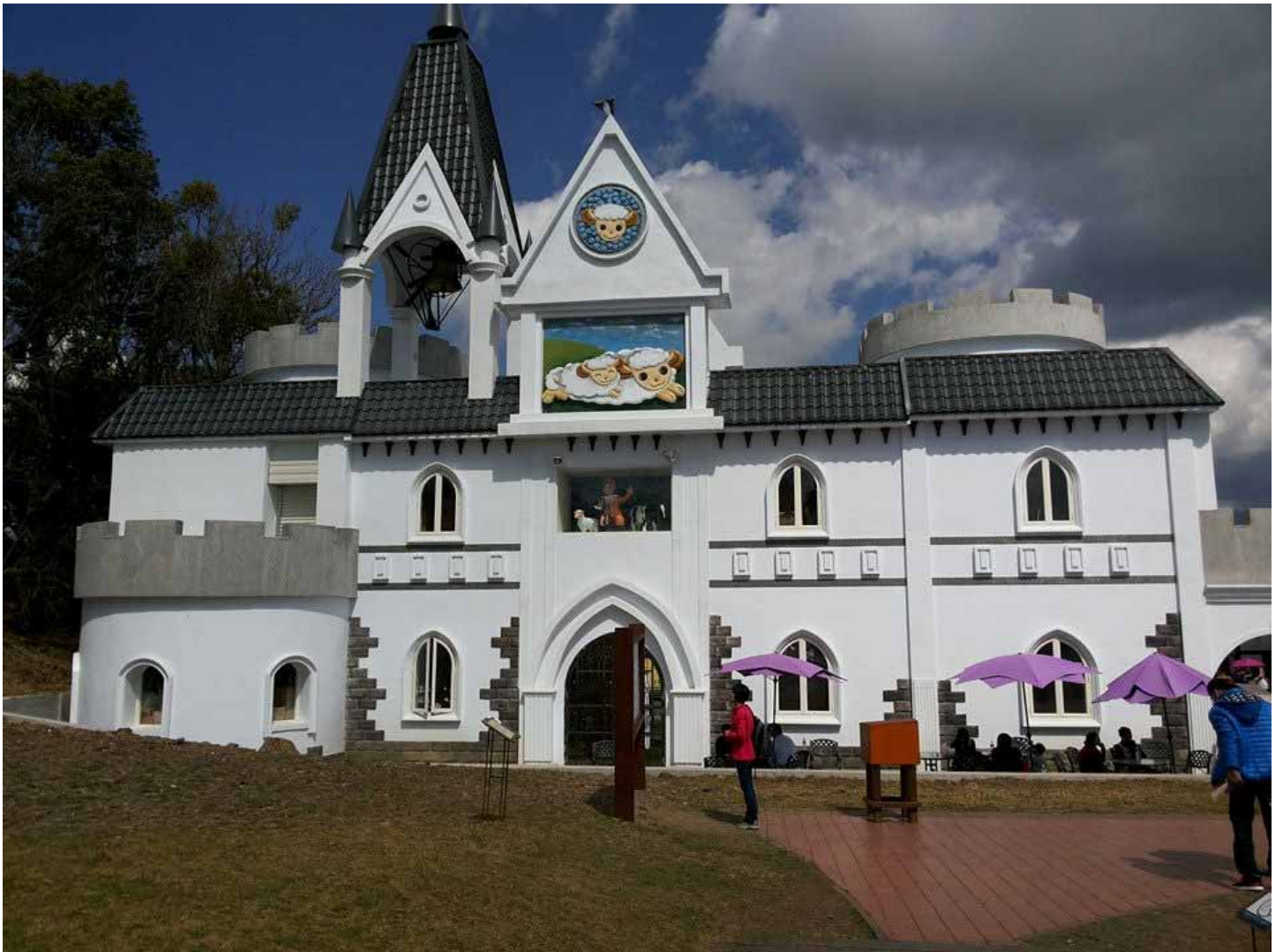
美麗的清境農場，是台灣三大高山農場之一，滿山翠綠盡入眼底