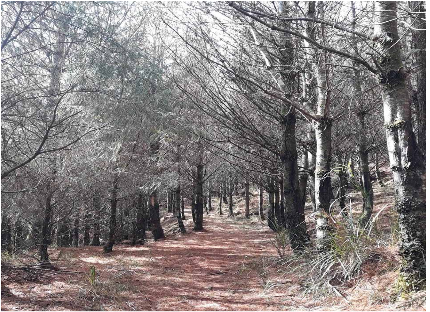
中之關封閉 10 年，敞開雙臂喜迎遊客的到來