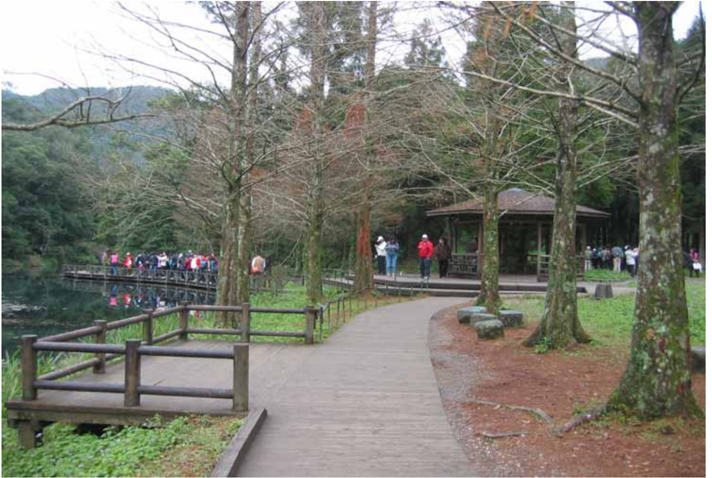
園區最美的人工水池，生態豐富，也是南勢溪的上游