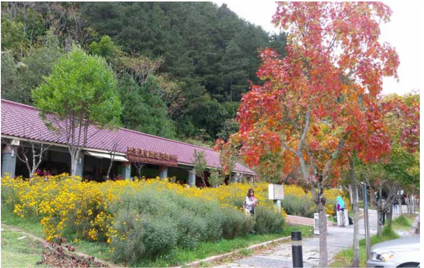
雪山山脈圍繞著的武陵農場，四季有不同的美感，是避暑首選之地