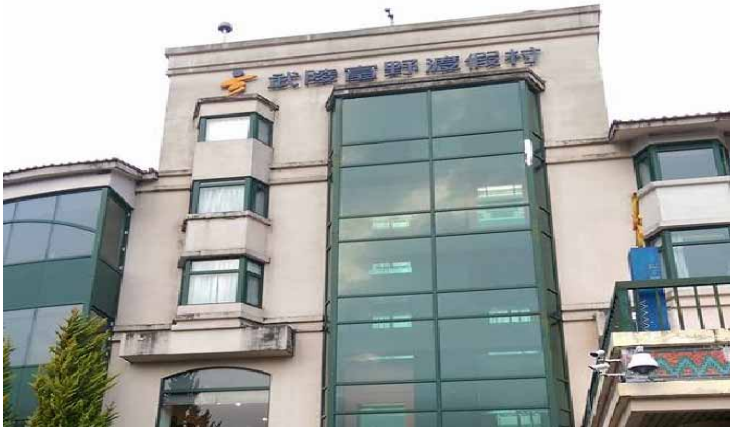
夜宿最高檔的富野渡假村，享受歐式自助餐，參加觀星、音樂會活動