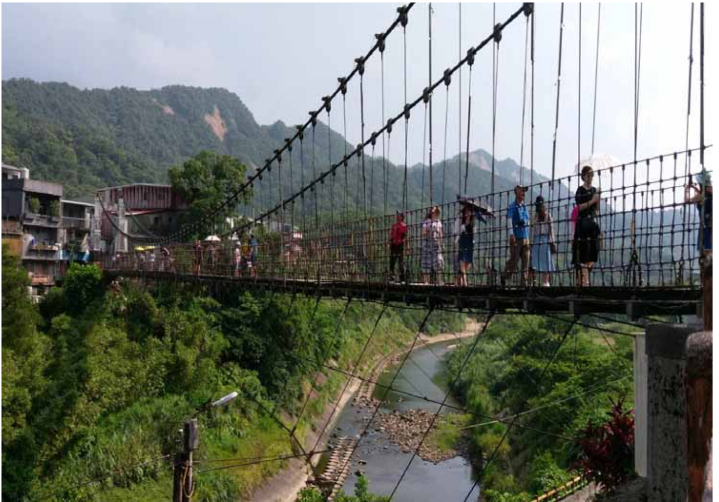
古樸的十分地區，不僅是煤礦重鎮，充沛水量吸引無數遊客