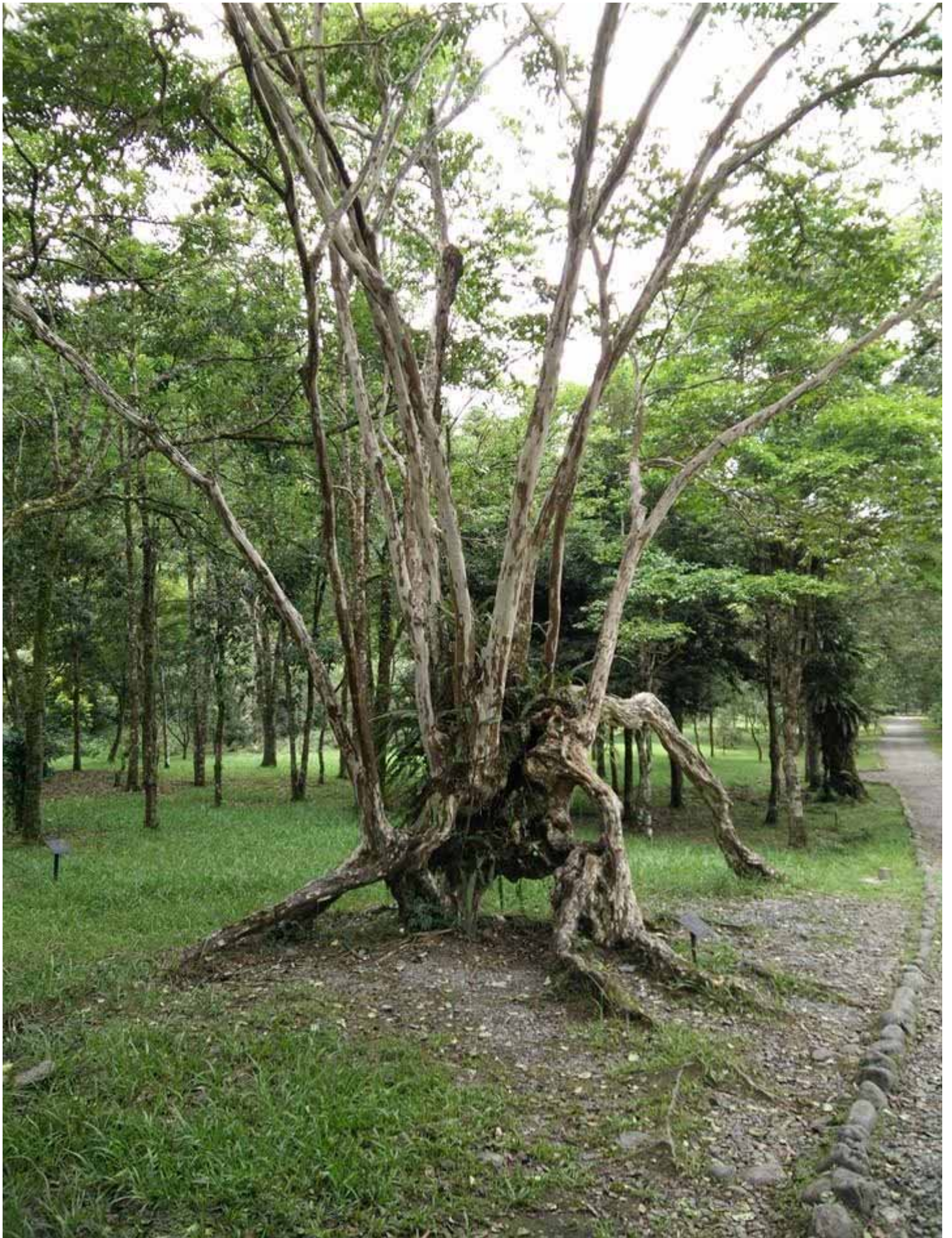
園區擁有珍貴的森林資源，及原生種植物，偶見山羌、野豬、鴛鴦、小鸛