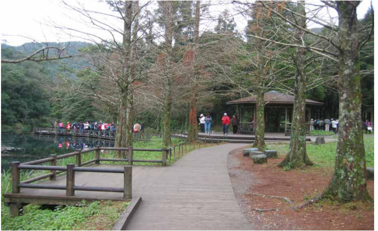
園區最美的人工水池，生態豐富，也是南勢溪的上游