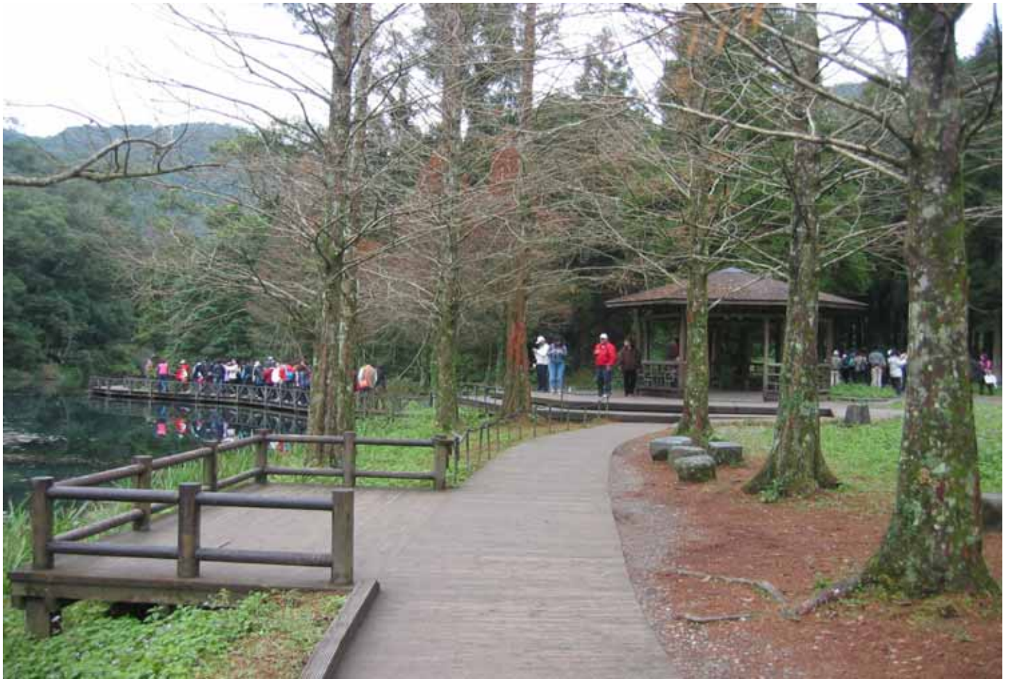
園區最美的人工水池，生態豐富，也是南勢溪的上游