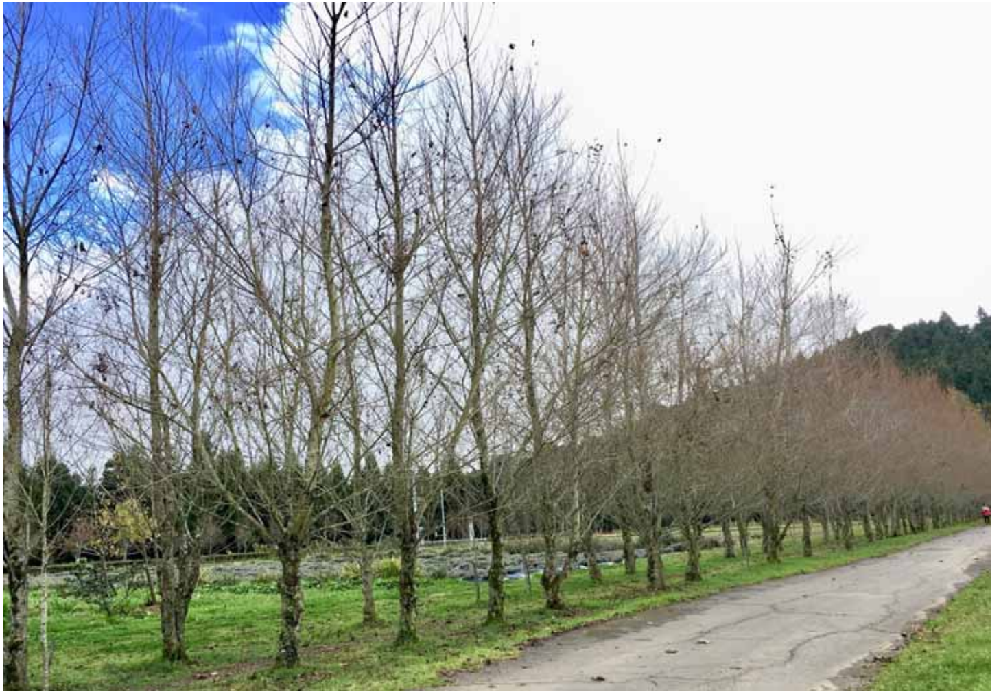
風情萬種的 " 白楊木步道 " ，為農場增添浪漫氣氛