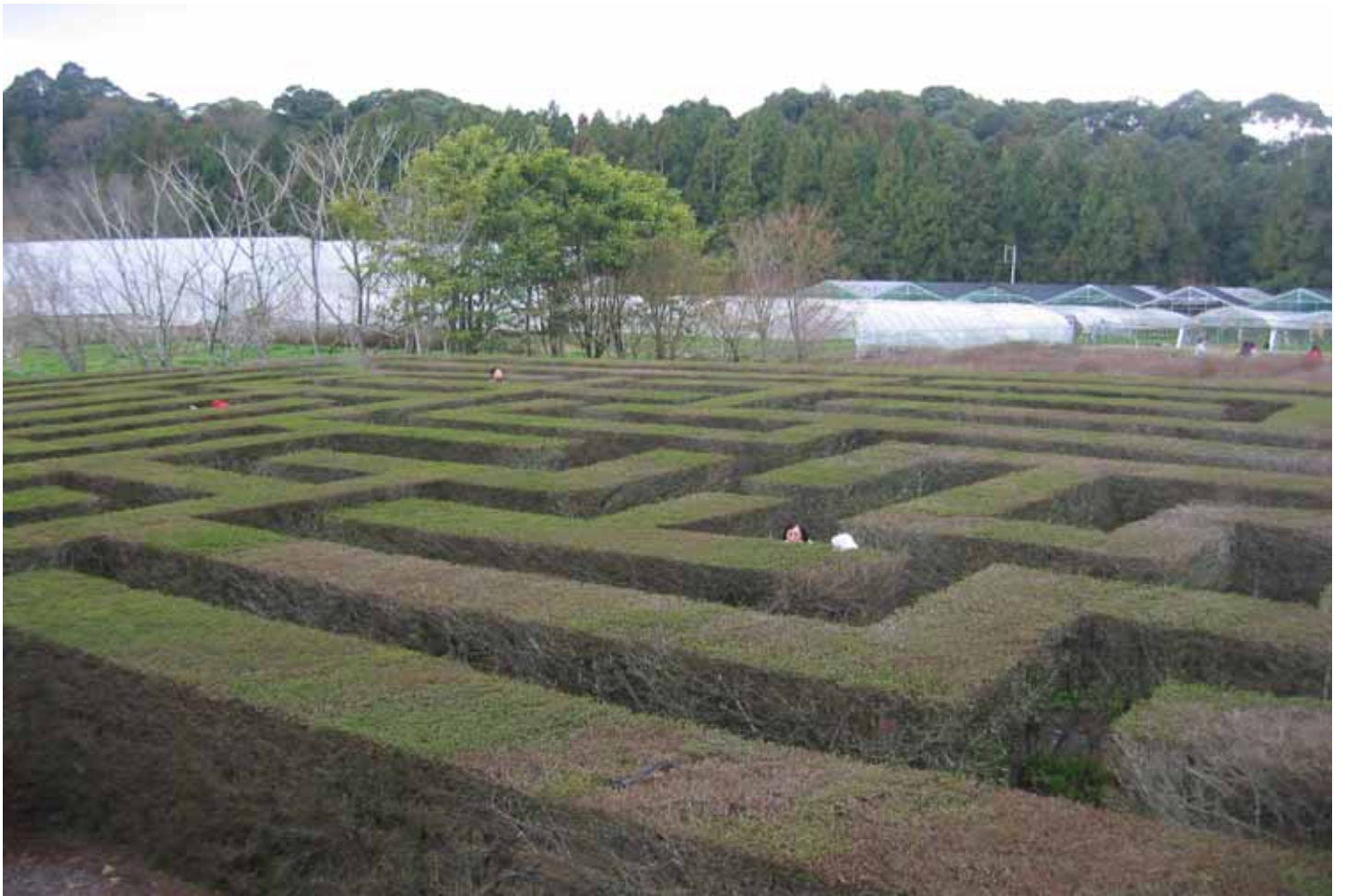
修剪整齊的綠籬，是大人小孩都能盡情玩樂的迷宮