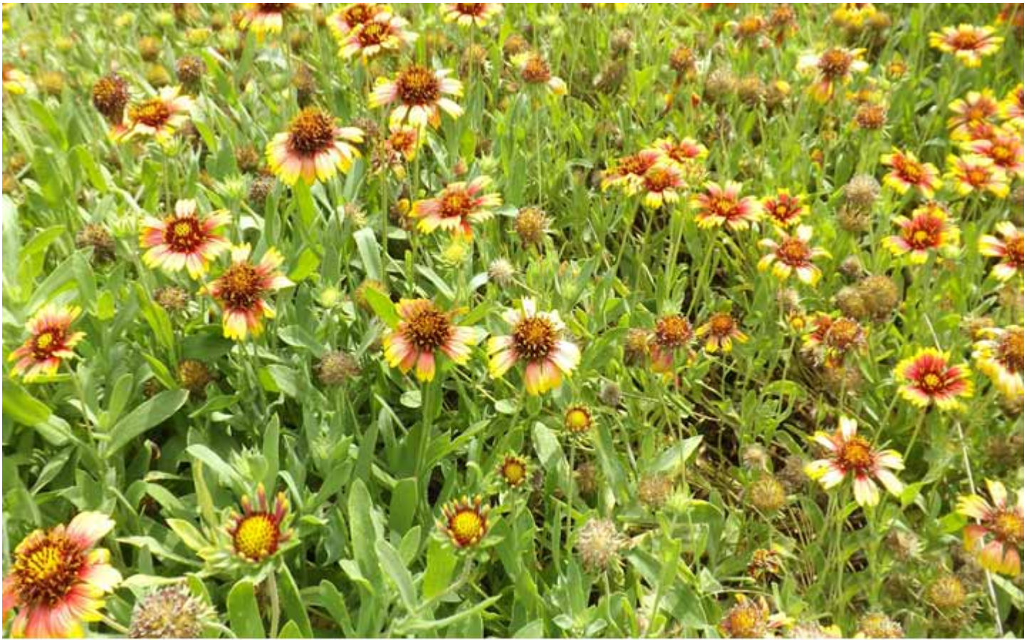
澎湖縣花-天人菊，故稱“菊島”，象徵居民與大自然搏鬥的堅忍毅力