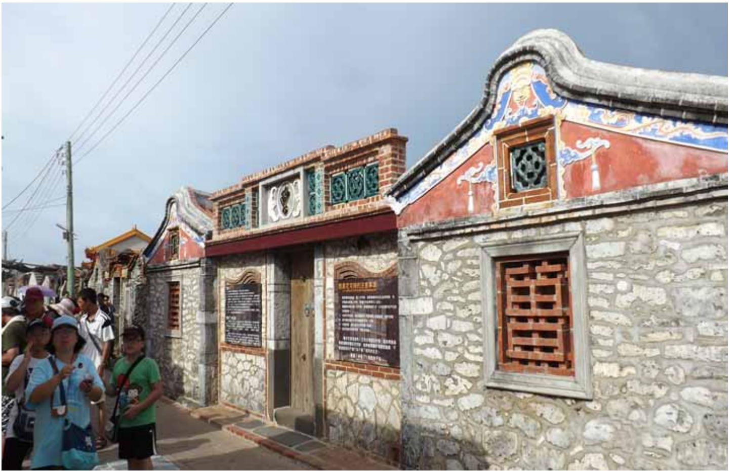
望安島上的中社花宅，是 300 多年歷史美麗老聚落群