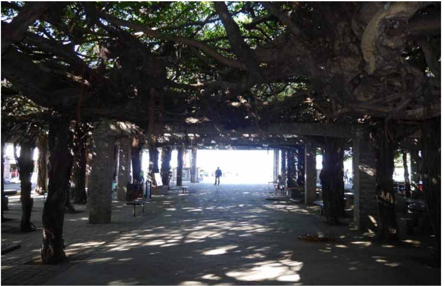
自清朝海上漂來，落地萌芽 400 多年的通樑古榕，守護著老廟