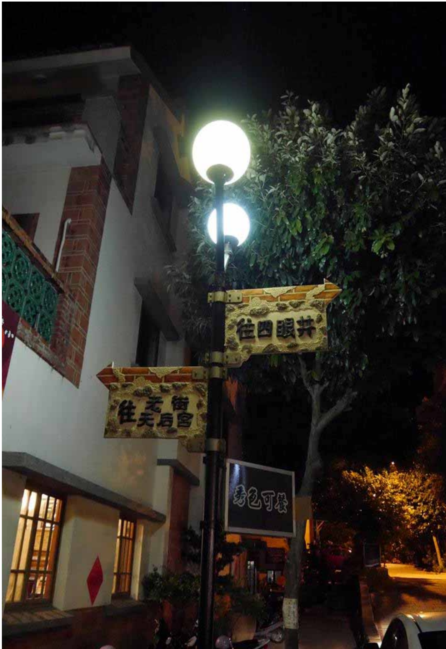
澎湖第一街 中央老街