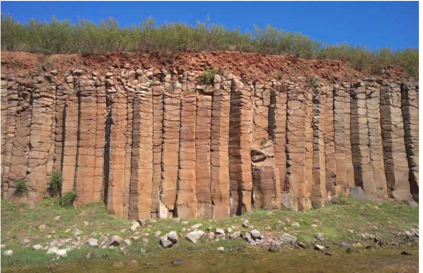
澎湖火山熔岩冷卻，形成的柱狀玄武岩，是台灣世界遺產的潛力點