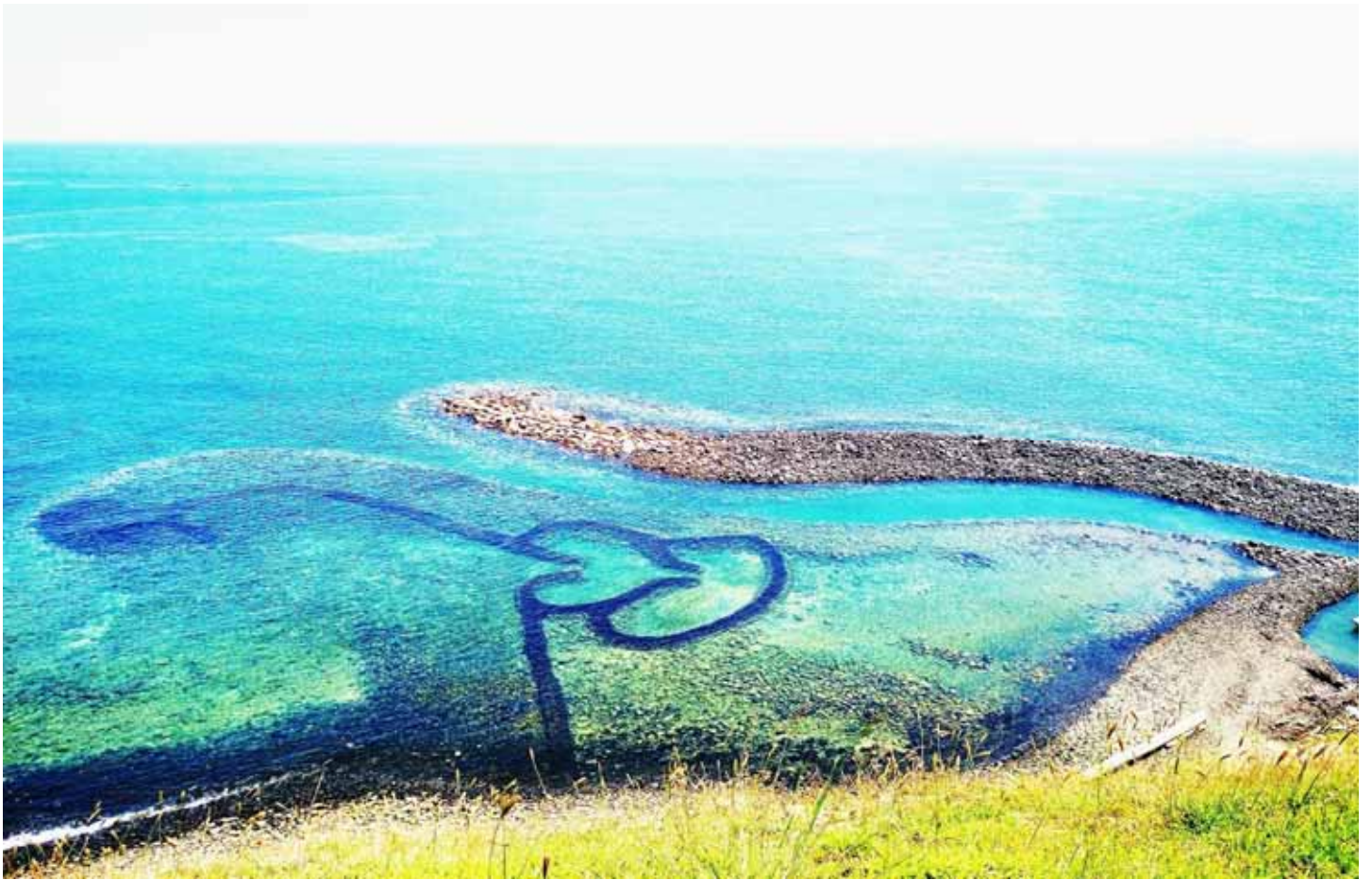
七美島雙心石滬，是古老的捕魚石牆，不少情侶在此見證愛情