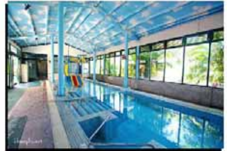
鹽水養生泳池、養生溫泉、三溫暖、健身房、親子娛樂廣場、花式撞球館、德州酒吧…等